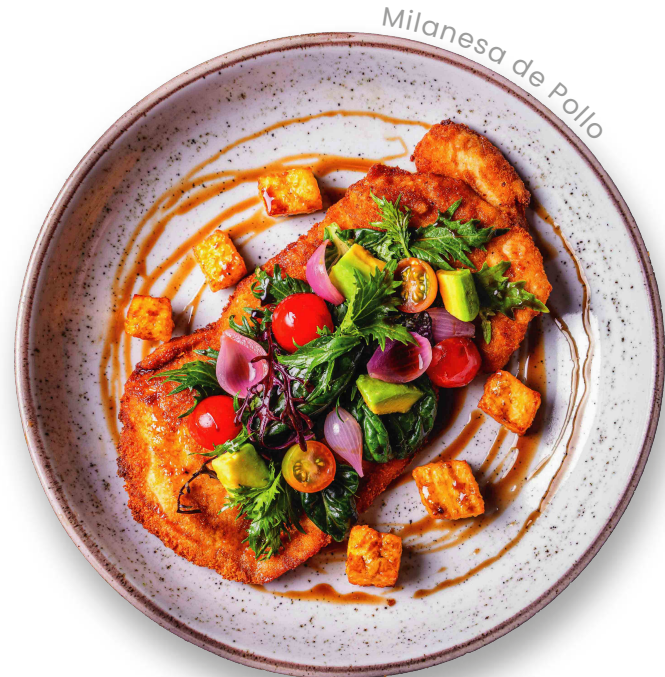
Milanesa de Pollo

Nuestros precios incluyen impuesto al consumo