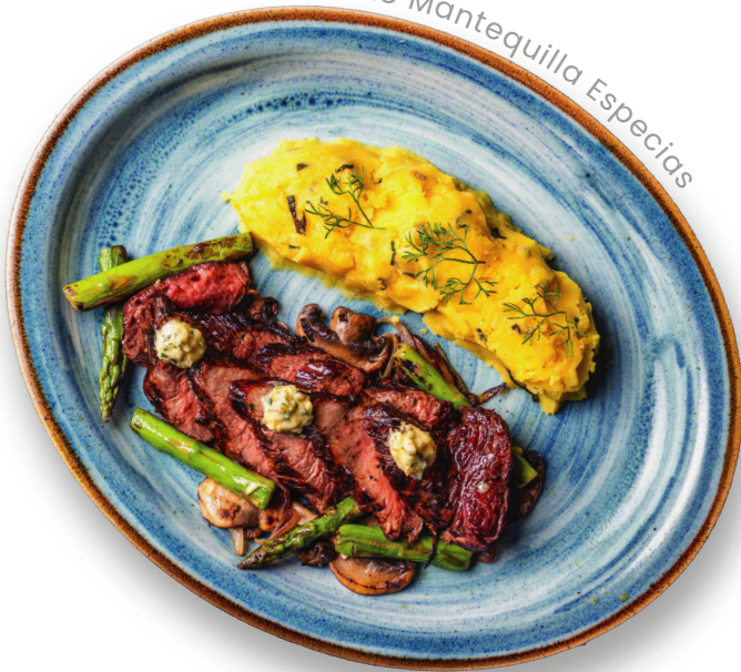
Lomo Mantequilla Especias