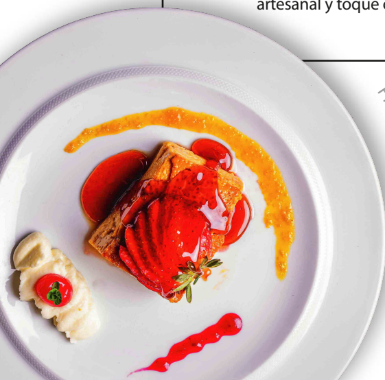
Flan de Caramelo