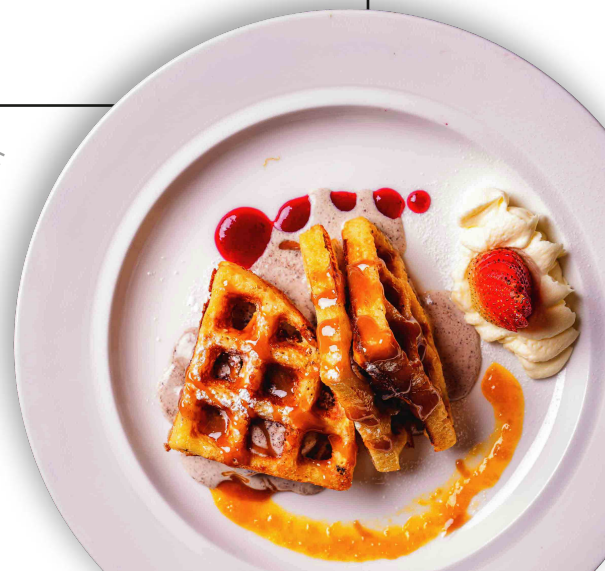
Waffle al Sartén

Nuestros precios incluyen impuesto al consumo