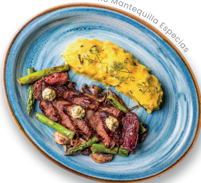
Lomo Mantequilla Especias