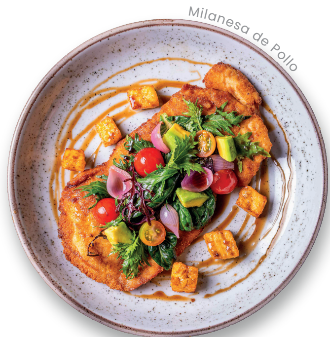
Milanesa de Pollo

Nuestros precios incluyen impuesto al consumo