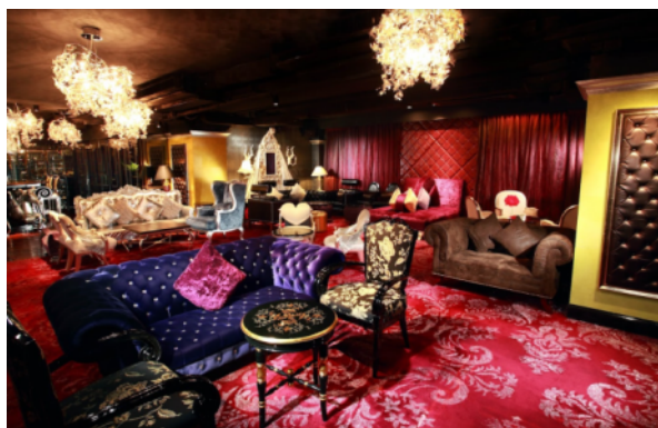
Dada Bar + Lounge 以達達主義為設計概念