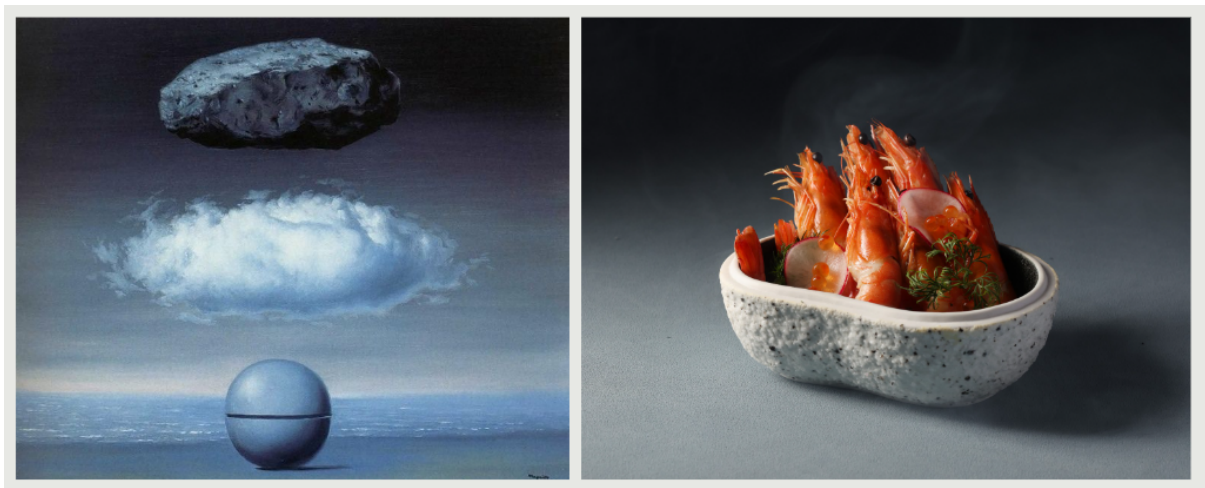
(左) 熟悉的世界 (1958) La Monde Familier

作品介紹: https://www.wikiart.org/en/rene-magritte/the-heartstrings-1960