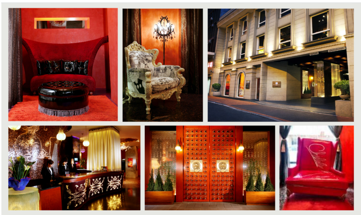
帝樂文娜公館每個角落均以獨特富藝術感的風格打造