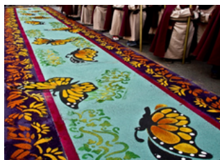
Xpapálotl en las leyendas mexicanas

Estas tradiciones muestran el sincretismo de elementos tan sutiles como una mariposa en alfombras donde pasan las andas de Cristo y la Virgen camino al Calvario. Para las culturas mesoamericanas las mariposas tenían un simbolismo con el sol, una de sus máximas deidades. Cabe mencionar que esa imagen no aparece en las actividades cuaresmales y de Semana Santa que se celebra en España