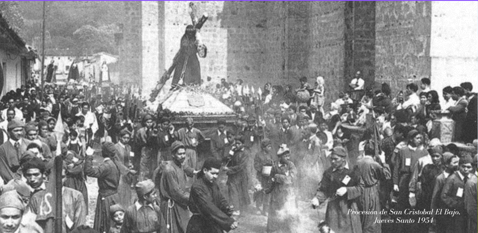
Procesión de San Cristobal El Bajo, Jueves Santo 1954