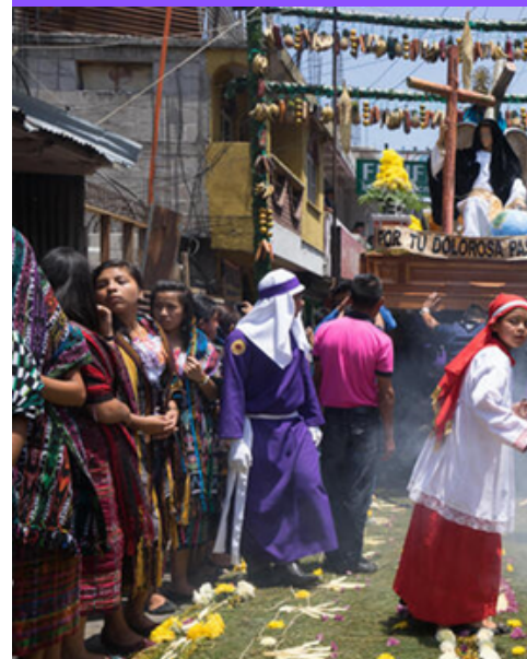
Arcos de frutas con olor a incienso y corozo en Santa Cruz del Quiché

El fervor católico que se vive en Guatemala tiene tintes casi mágicos y místicos debido al sincretismo entre las religiones prehispánicas y la doctrina católica, donde se combinan elementos mesoamericanos que datan desde antes de la llegada de los castellanos en 1524, con el catolicismo impuesto después de la conquista a lo largo de varios siglos del periodo hispánico y las actuales culturas mesoamericanas