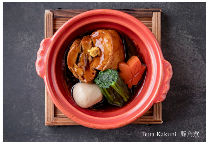
Buta Kakuni 豚角煮

Wagyu Sirloin Tobanyaki (130 g) 4,600 和牛サーロイン陶板焼き (130 g) Wagyu sirloin beef grilled on a ceramic plate