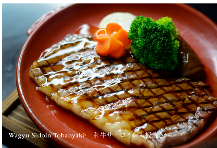
Wagyu Sirloin Tobanyaki 和牛サーロイン陶板焼き