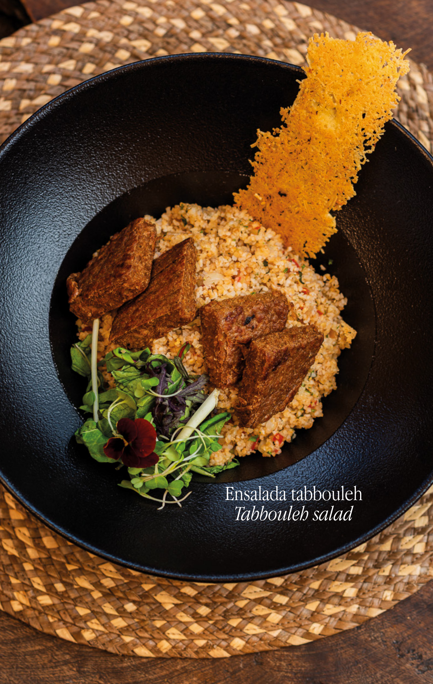
Ensalada tabbouleh Tabbouleh salad