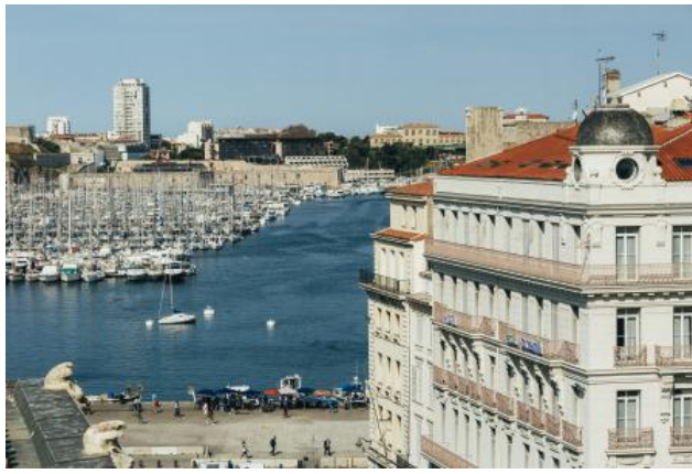
Escale Oceania Marseille 3*