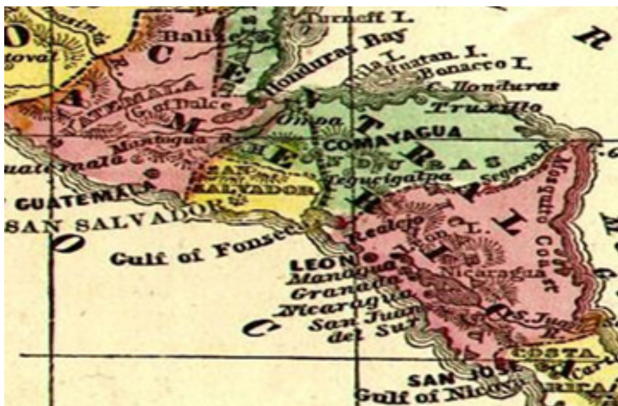
Mapa de las provincias unidas del Centro de América