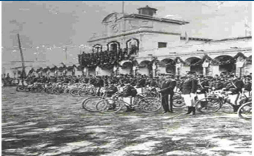
Real Palacio de Guatemala donde se firmó el acta de Independencia, 1821

El acta de Independencia se firmó en el Real Palacio, localizado al oeste de la Plaza Central de la Ciudad de Guatemala, el cual fue destruido por los terremotos de 1917. Actualmente el Acta se resguarda en el Museo Nacional de Historia.