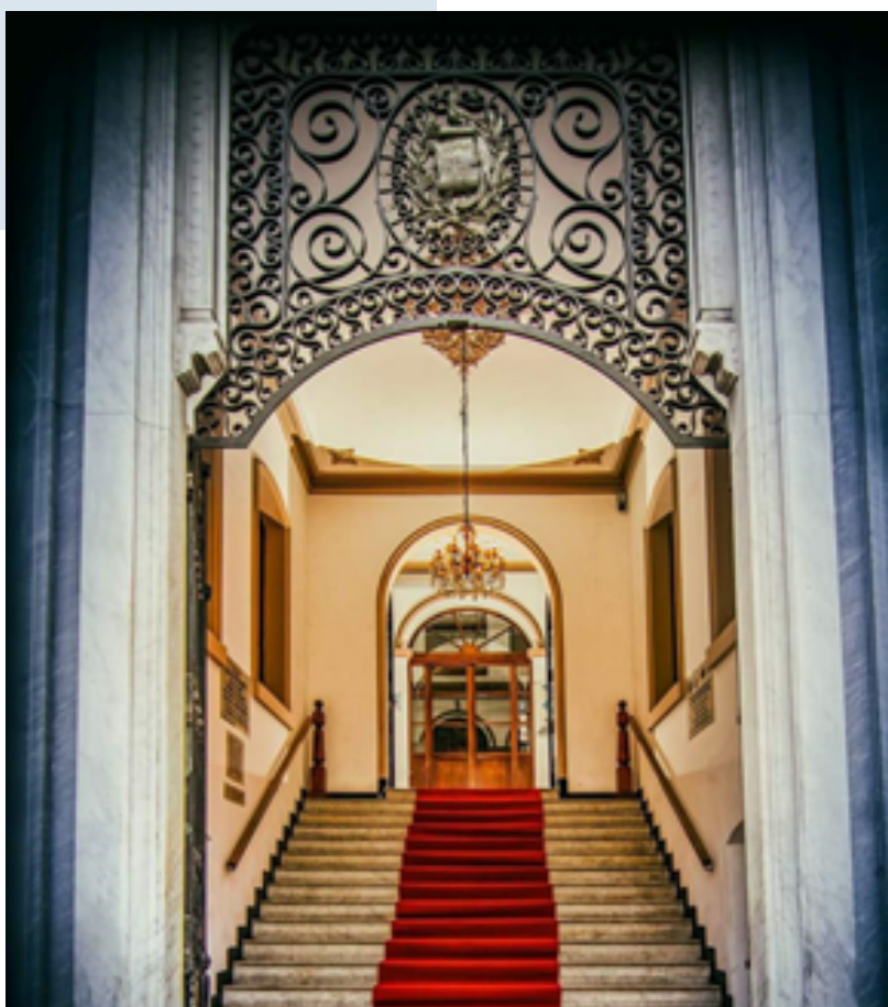
Escalinata entrada Museo Nacional de Historia

Se agradece encarecidamente al Licenciado Miguel Álvarez, Director del Museo Nacional de Historia y a la Dirección de Museos del Ministerio de Cultura y Deportes, la reproducción de las obras que en esta oportunidad Hoteles Porta se complace en presentar a sus huéspedes y visitantes