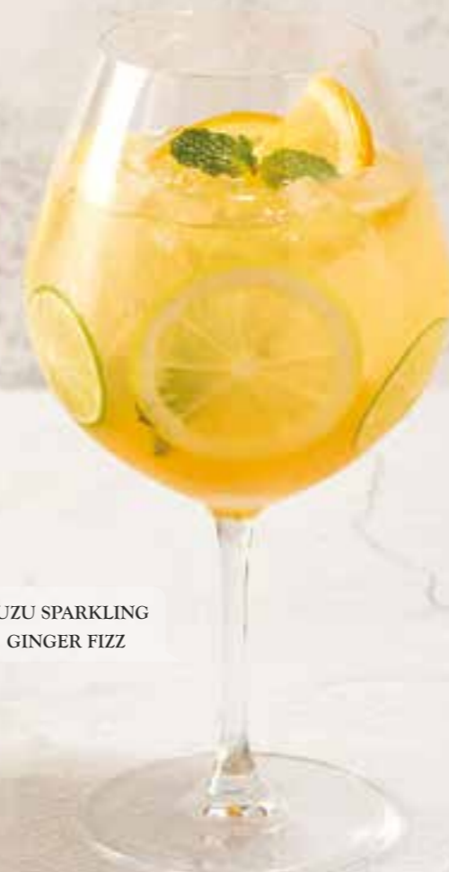
YUZU SPARKLING GINGER FIZZ