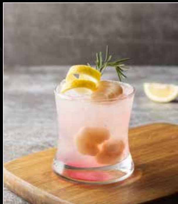
1. THE LIBRARY 320 rum, pink grapefruit, lychee, lime