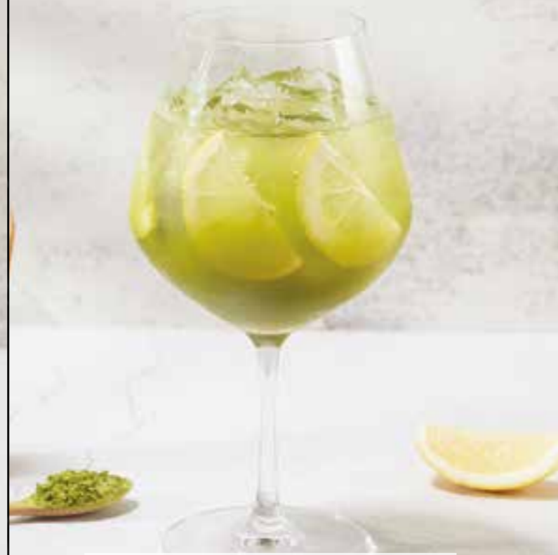
24. MATCHA LEMON 150 Uji matcha, lemon juice