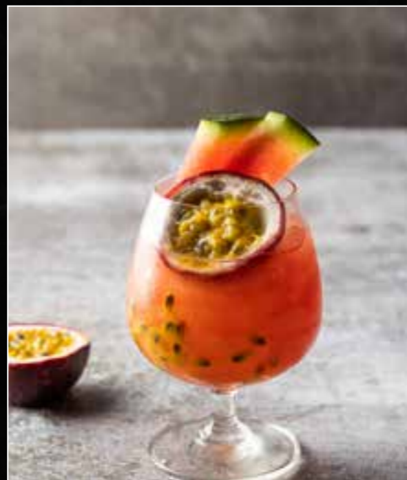
2. CHIANG MAI PASSION 320 vodka, passion fruit, watermelon, lime