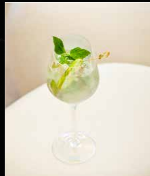
5. TROPICAL THAI BASIL BLISS 320 Thailand's Kosapan Rum, Flor de Caña Coco liqueur, Thai basil, fresh lime juice and soda water - a tantalizing Thai-inspired blend