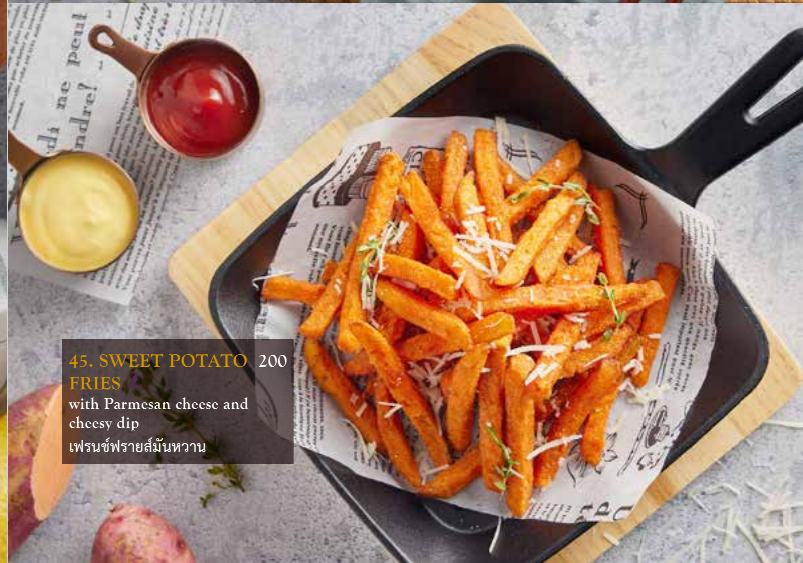
45. SWEET POTATO FRIES 200 with Parmesan cheese and cheesy dip เฟรนช์ฟรายส์มันหวาน