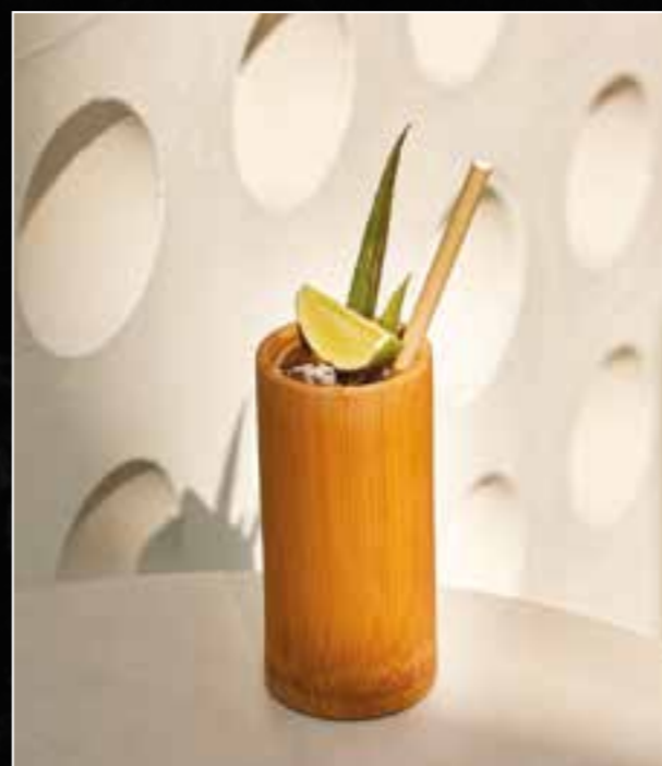
4. PISCO TANGO 320 crafted with Peruvian Demonio de Los Andes Pisco, Giffard Apricot liqueur, cranberry cordial, fresh lime juice and topped with Fever-Tree Mediterranean Tonic