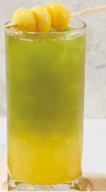
22. MATCHA MANGO 150 Uji matcha, mango juice