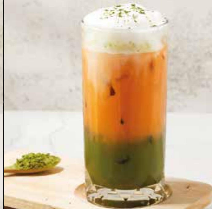
23. MATCHA THAI TEA 150 Uji matcha, royal Thai tea, milk