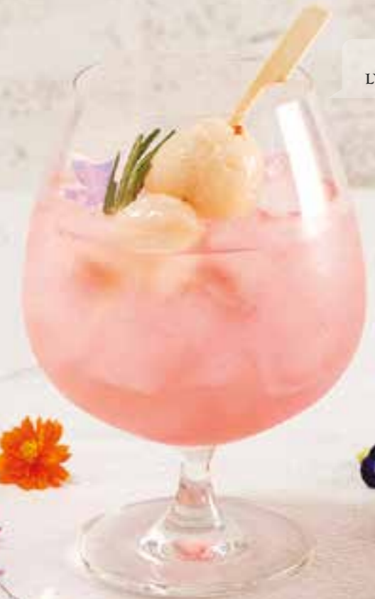
SAKURA LYCHEE FIZZ

28. THAI LIME SODA 120 freshly squeezed lime soda