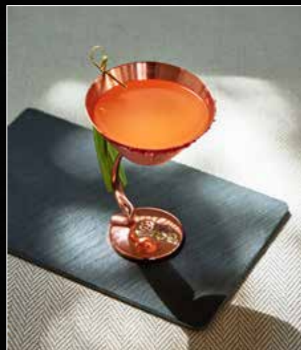
6. SURF & SIP 320 an exotic blend of tropical fruits, 4-year barrel-aged Flor de Caña Rum, a touch of coffee liqueur and a tempting plum salt rim