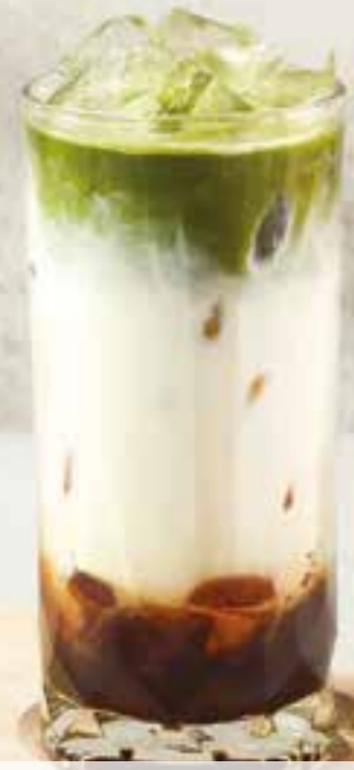
21. DIRTY MATCHA ESPRESSO LATTE 150 Uji matcha, milk, espresso