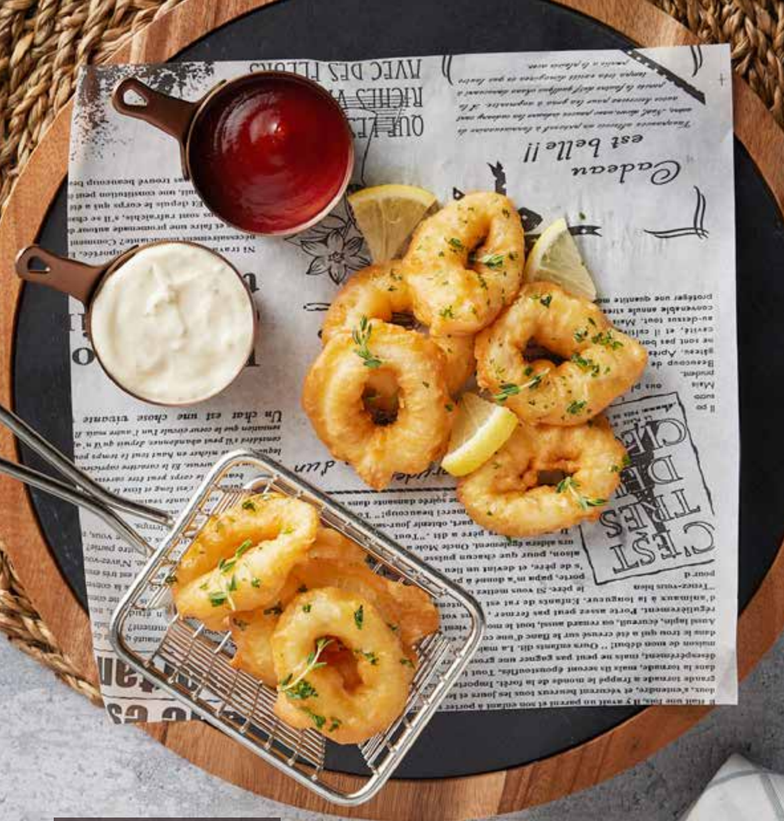
43. CAJUN SALT & PEPPER CALAMARI 280 deep-fried breaded calamari tossed in Cajun seasoning, sea salt and pepper, served with tartar sauce คาลามารี่