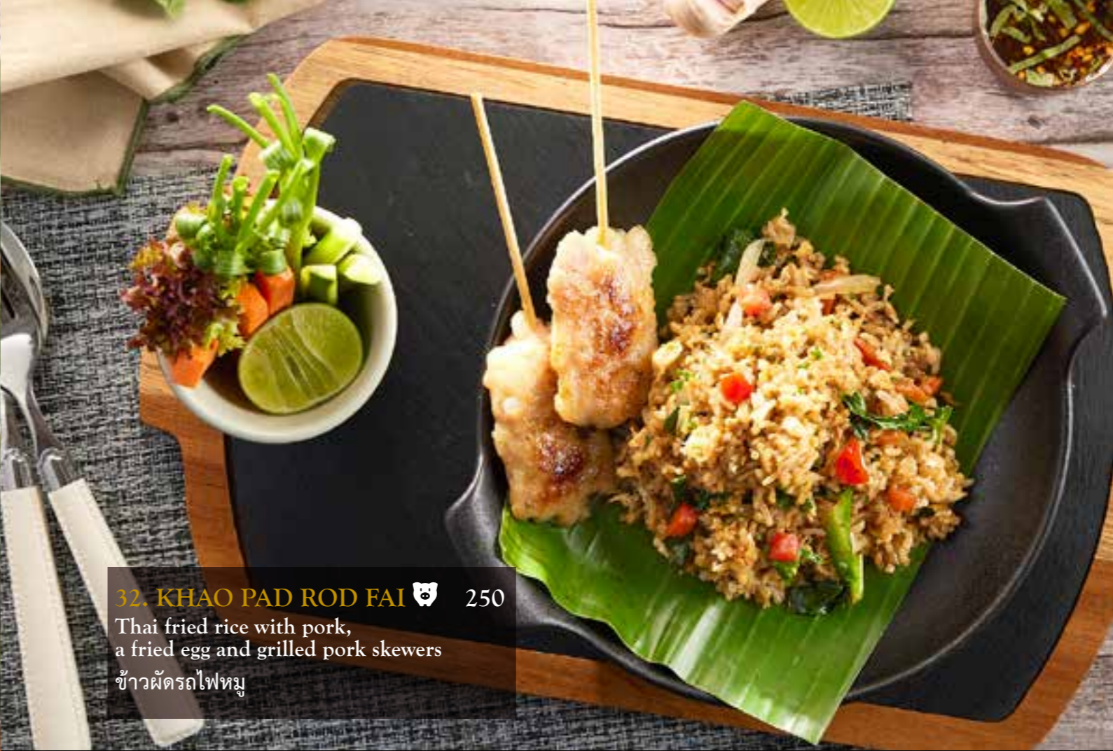
32. KHAO PAD ROD FAI 🐷 250 Thai fried rice with pork, a fried egg and grilled pork skewers ข้าวผัดรถไฟหมู