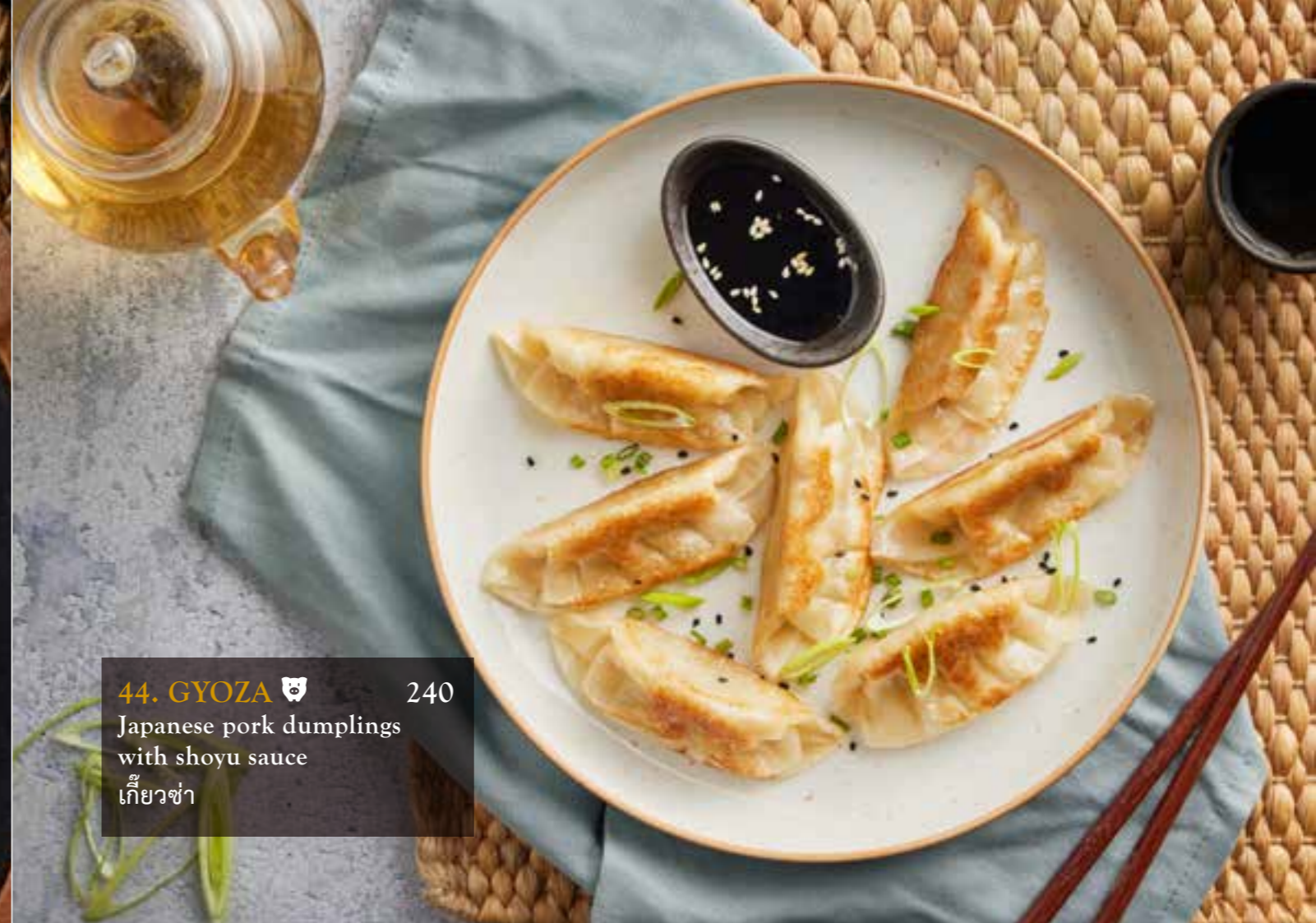
44. GYOZA 240 Japanese pork dumplings with shoyu sauce เกี้ยวซ่า