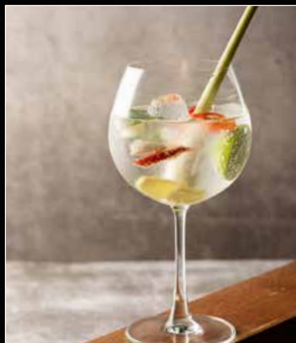
3. LANNA LANNA 320 vodka, ginger, lemongrass, chilli