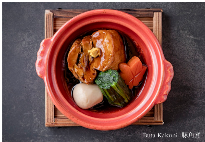
Buta Kakuni 豚角煮

Wagyu Sirloin Tobanyaki (130 g) 4,600 和牛サーロイン陶板焼き (130 g) Wagyu sirloin beef grilled on a ceramic plate