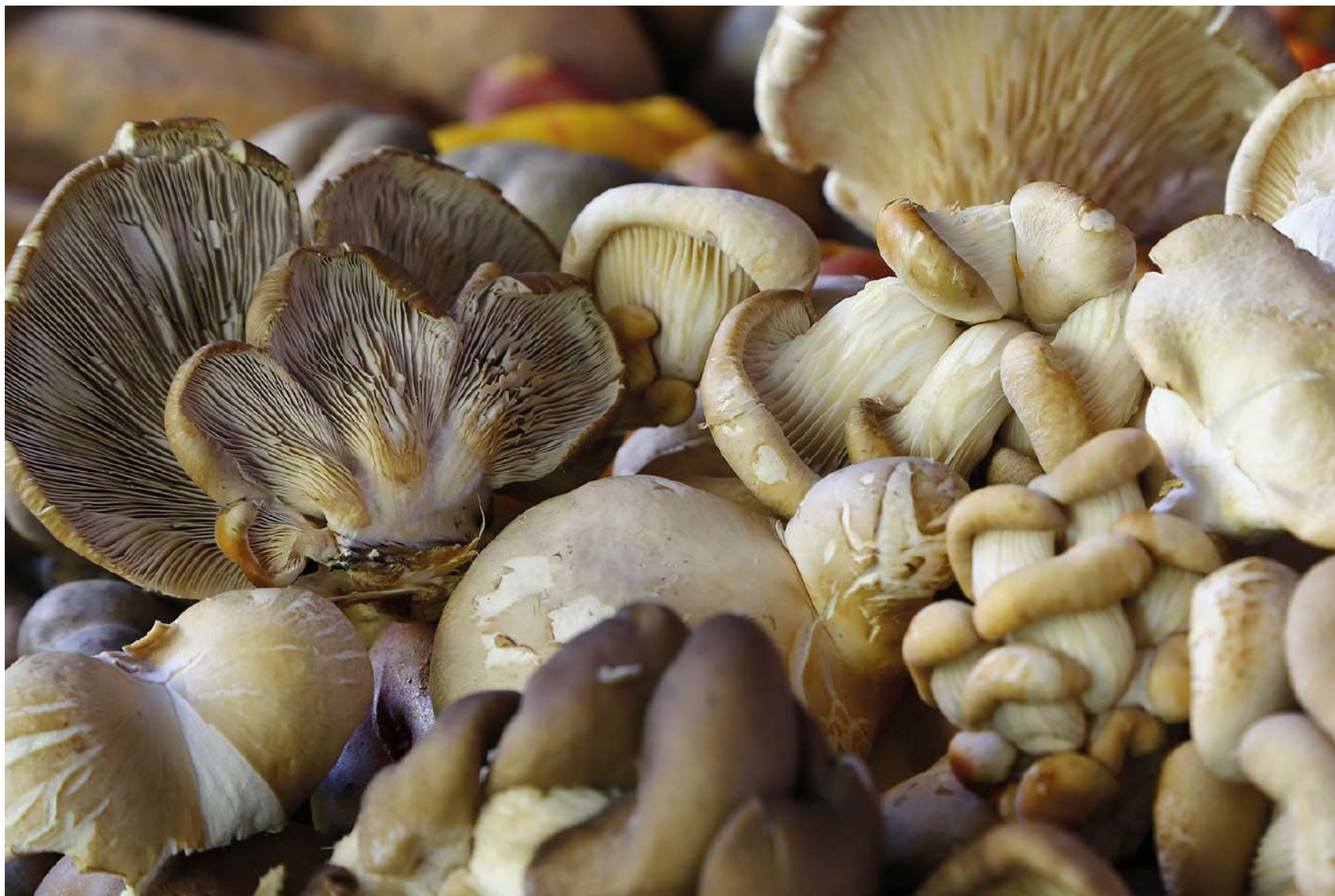
Os cogumelos tipo Ostras

Associação Conchacalla Distrito: Izcucacha Provincia: Anta Altitude: 3345m