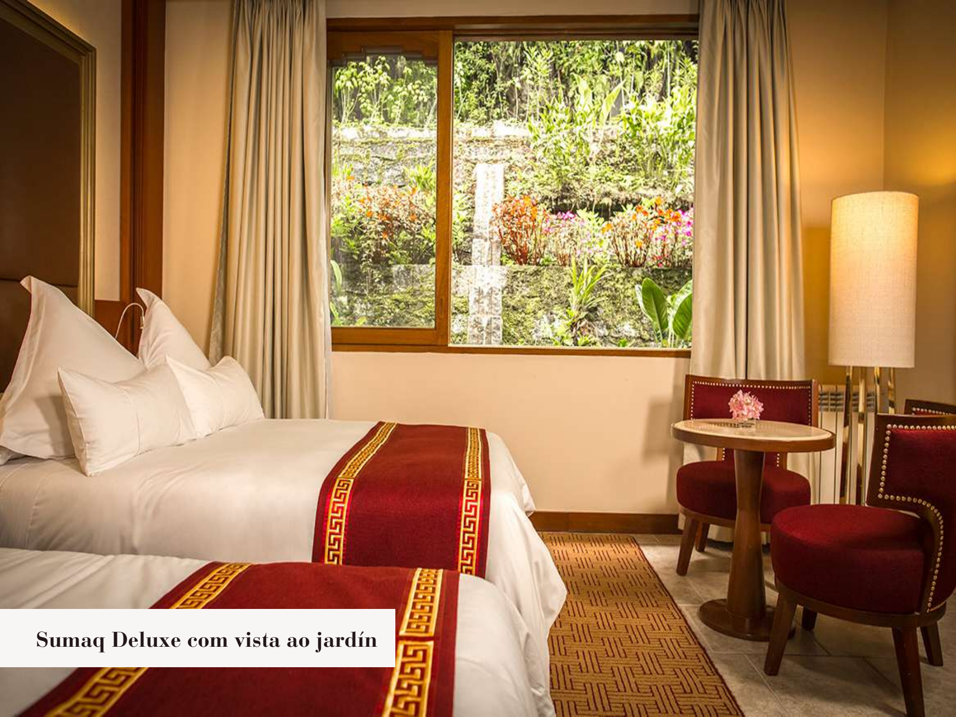
Sumaq Deluxe com vista ao jardim