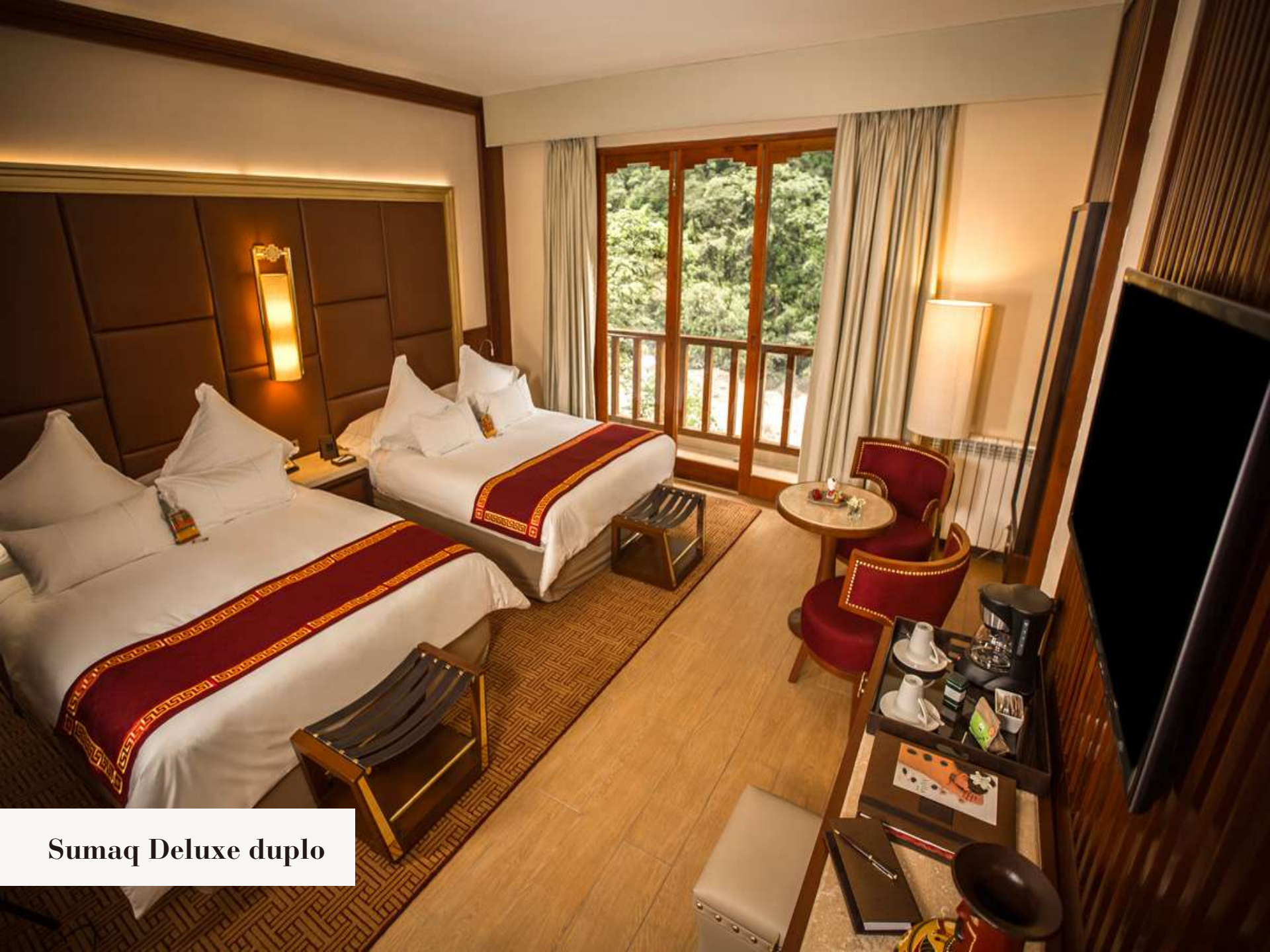
Sumaq Deluxe duplo