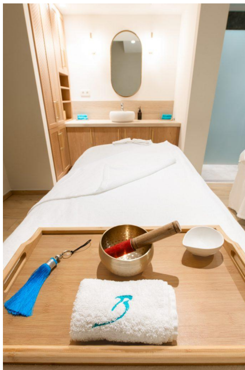
Château de la Bégude The Originals Collection Salle de massage