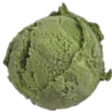
MATCHA TRÀ XANH