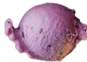
TARO KHOAI MÔN