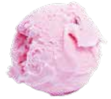
STRAWBERRY DÂU TÂY