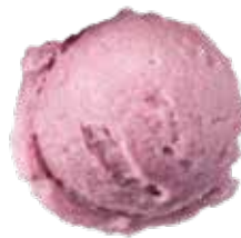
BLUEBERRY VIỆT QUẤT