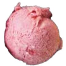
RASPBERRY MÂM XÔI