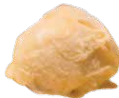
PASSION FRUIT CHANH DÂY