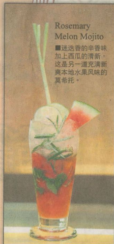
Rosemary Melon Mojito