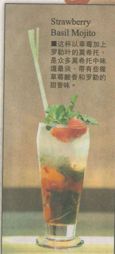
Strawberry Basil Mojito

■这是一杯酒精非常高的莫希托，用了尊麻酒、黑兰姆酒和安哥斯图那苦精混合薄荷叶、青柠、苏打水和糖浆。两层颜色非常美丽，入口酒精味淡，却也要有深度及层次感，是酒量好且想要得到微醺者该点的鸡尾酒。