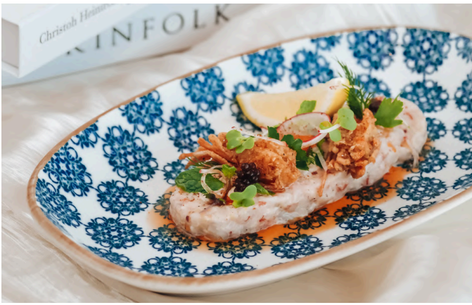
虾鞑鞑 (S) 690 红虾 / 石榴 / 烟熏辣椒粉 / 柠檬 / 酸橙 / 海蓬子 / 特级初榨橄榄油