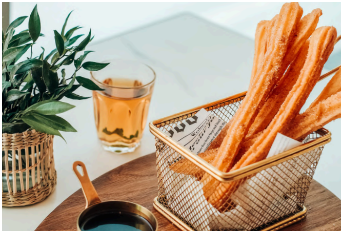
西班牙油条 (VG, G, D) 290 炸面团 / 肉桂糖 / 巧克力橙酱