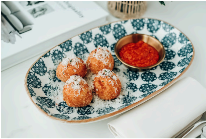
阿兰奇尼 (G, E, D, B, A) 330 藏红花烩饭 / 马苏里拉奶酪 / 番茄酱 / 碎牛肉