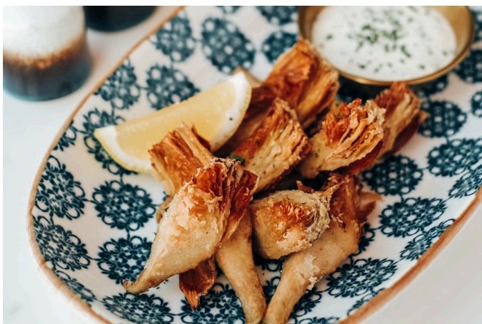
炸洋蓟 (V, G, D) 320 柠檬 / 特级初榨橄榄油 / 辣根酸奶酱