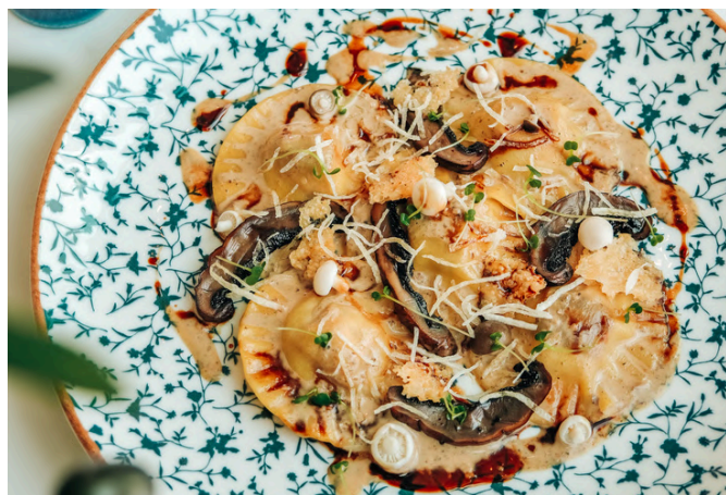
鹅肝馄饨 (G, E, S, N) 🌿 750 松露奶油 / 帕尔马干酪 / 榛子 / 野芝麻菜