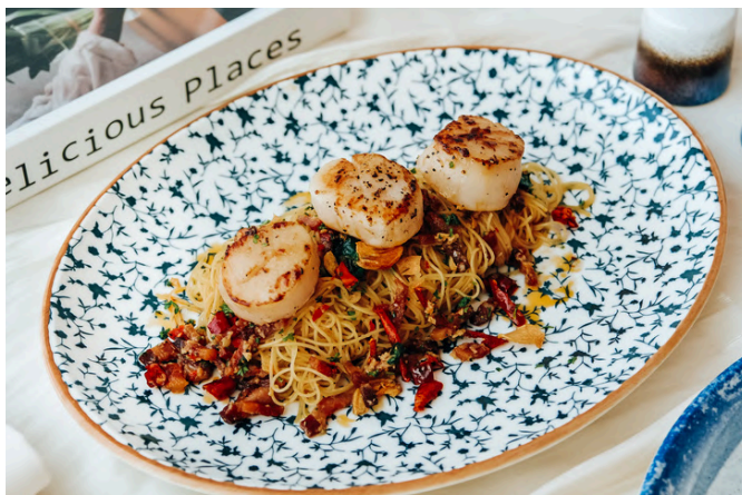
扇贝意面 (G, P, S, A, 🌶️) 990 培根 / 大蒜 / 辣椒 / 橄榄油 / 欧芹 / 罗勒