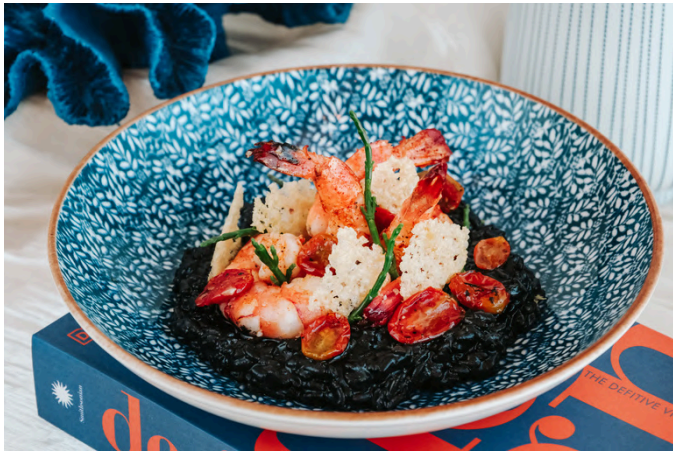
克罗地亚黑烩饭 (D, S, A) 790 虎虾 / 墨鱼汁 / 帕尔马干酪 / 欧芹 / 白葡萄酒 / 圣女果