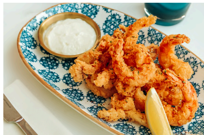
意式什锦炸海鲜 (G, E, S) 490