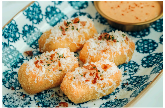
塞拉诺火腿可乐饼 (G, E, D, P) 330 塞拉诺火腿 / 埃曼塔奶酪 / 烟熏辣椒蛋黄酱