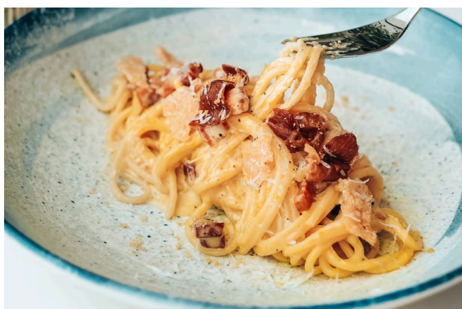
罗马面食 (G, E, D, P) 450 培根 / 蛋黄 / 碎胡椒 / 佩科里诺干酪