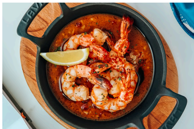
黄油蒜蓉虾 (D, S, A) 490