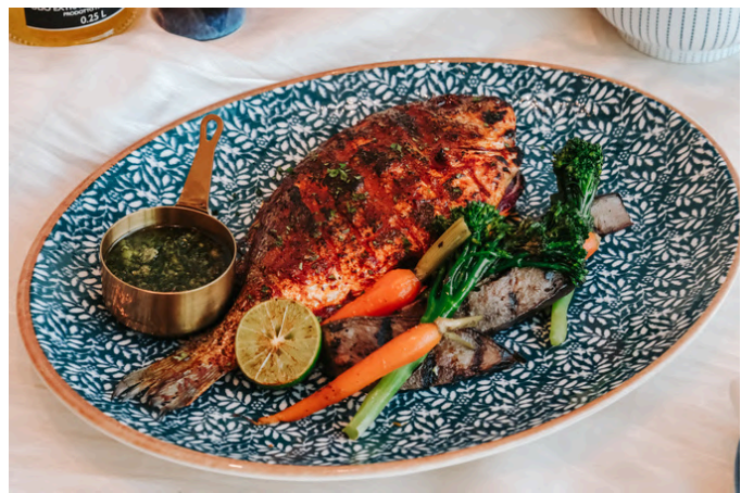
烤整条鲷鱼 (S, 🌶️ 🌿) 1,100 哈里萨辣酱 / 烤蔬菜 / 柠檬蜜饯香草酱