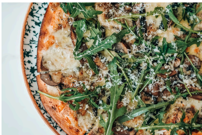
松露 (V, G, D) 590