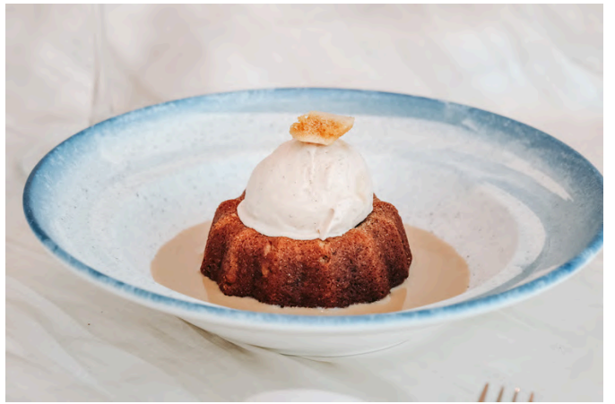
椰枣布丁 (V, G, E, D, N) 350 美珠枣 / 蜂窝 / 蜂花粉 / 咸焦糖酱 / 核桃冰淇淋