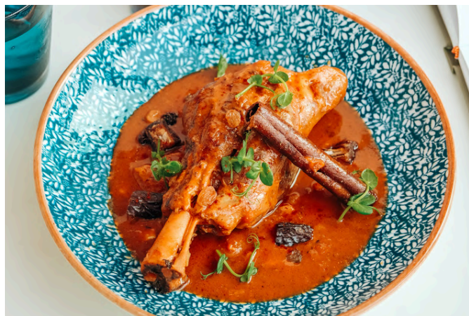
羊腿塔吉锅 (N) 890 摩洛哥香料 / 蒸粗麦粉 / 鹰嘴豆 / 干果 / 野生丛林蜂蜜