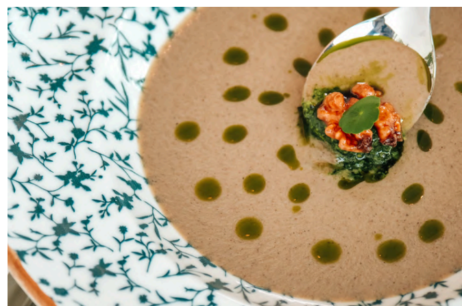
牛肝菌奶油汤 (V, D, N) 310 牛肝菌 / 黑胡桃 / 香蒜酱