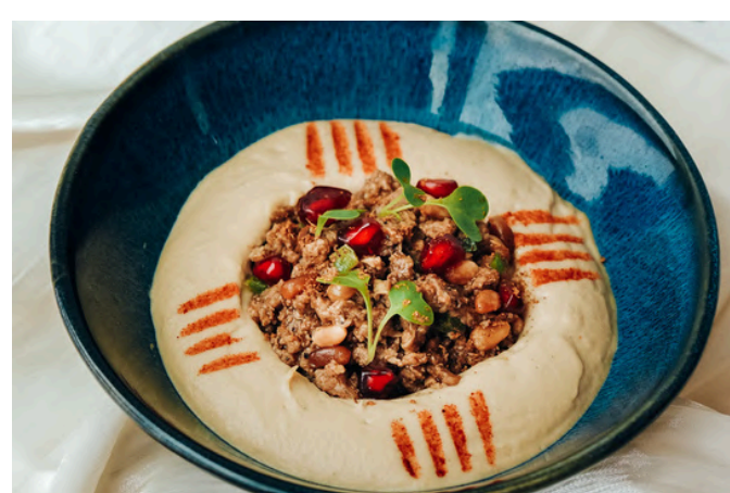
卡瓦尔玛鹰嘴豆泥 (N) 300 鹰嘴豆 / 碎羊肉 / 松子 / 柠檬酱

VG - Vegan (素食主义者) | V - Vegetarian (素食) | G - Contains Gluten (含有麸质) | E - Contains Egg (含鸡蛋) | D - Contains Dairy (包含乳制品) B - Contains Beef (含牛肉) | P - Contains Pork (含有猪肉) | S - Contains Fish/Shellfish (包含鱼类/贝类) | A - Contains Alcohol (含有酒精) N - Contains Nuts/Seeds (含有坚果/种子) | 🌶️ - Spicy (辣味菜) | 🌿 - Recommended (主厨推荐)