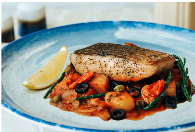
西班牙三文鱼鲈鱼 (S, A) 890 西西里风味番茄酱 / 漆树 / 橄榄 / 香菜 / 凤尾鱼