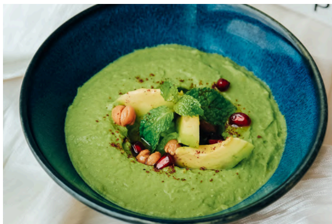
鳄梨鹰嘴豆泥 (VG) 270 鹰嘴豆 / 鳄梨 / 芝麻酱 / 特级初榨橄榄油