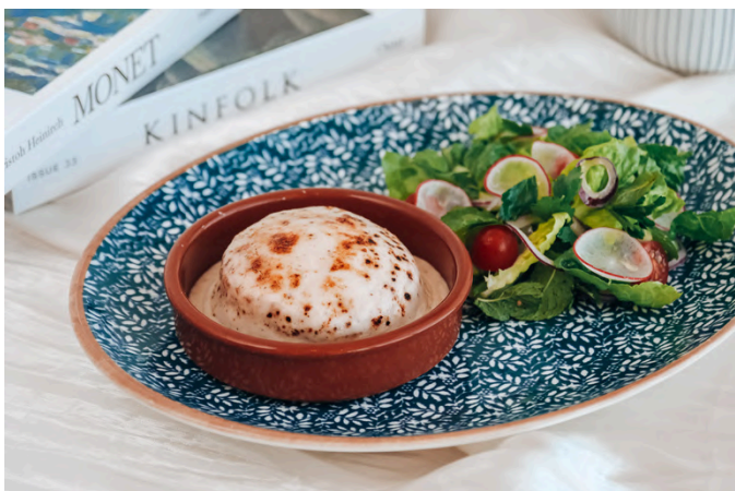
烤奶酪蛋奶酥 (V, G, E, D) 390