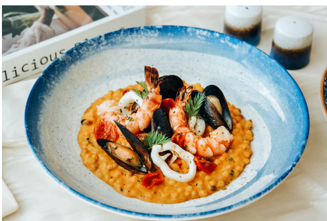
海鲜意面配 (G, S, A) 🌿 890 贻贝 / 鱿鱼 / 虎虾 / 番茄酱 / 奶油 / 埃曼塔干酪 / 罗勒

VG - Vegan (素食主义者) | V - Vegetarian (素食) | G - Contains Gluten (含有麸质) | E - Contains Egg (含鸡蛋) | D - Contains Dairy (包含乳制品) B - Contains Beef (含牛肉) | P - Contains Pork (含有猪肉) | S - Contains Fish/Shellfish (包含鱼类/贝类) | A - Contains Alcohol (含有酒精) N - Contains Nuts/Seeds (含有坚果/种子) | 🌶️ - Spicy (辣味菜) | 🌿 - Recommended (主厨推荐)