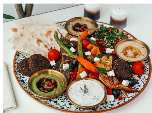
地中海拼盘 (V, G, D, N) 650 牛油果鹰嘴豆泥 / 鹰嘴豆泥 / 橄榄 / 茄子泥 / 酸奶黄瓜酱 / 蔬菜 / 沙拉三明治 / 皮塔饼 / 塔布勒沙拉

VG – Vegan (素食主义者) | V – Vegetarian (素食) | G – Contains Gluten (含有麸质) | E – Contains Egg (含鸡蛋) | D – Contains Dairy (包含乳制品) B – Contains Beef (含牛肉) | P – Contains Pork (含有猪肉) | S – Contains Fish/Shellfish (包含鱼类/贝类) | A – Contains Alcohol (含有酒精) N – Contains Nuts/Seeds (含有坚果/种子) | 🌶️ – Spicy (辣味菜) | 🌿 – Recommended (主厨推荐)