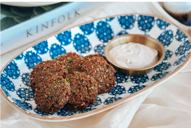
沙拉三明治 (V, D, N) 290 鹰嘴豆 / 欧芹 / 香菜 / 白芝麻 / 孜然 / 芝麻酱