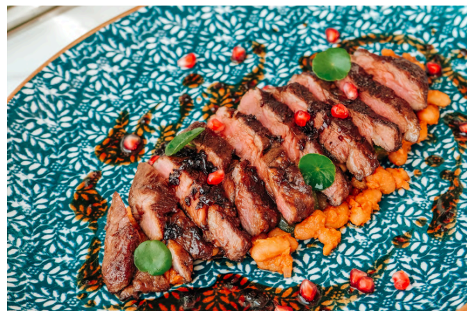
伊比利亚猪肉侧腹 (P, N) 1,600 烤猪肉 / 香肠 / 白豆炖菜 / 石榴酱 / 墨西哥辣椒