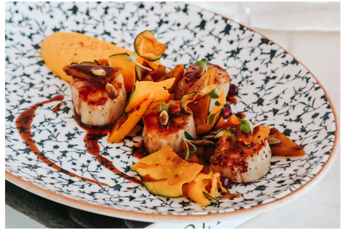
炙烤北海道带子 (S, A, N) 890 南瓜泥 / 南瓜籽 / 豌豆苗 / 扇贝汁