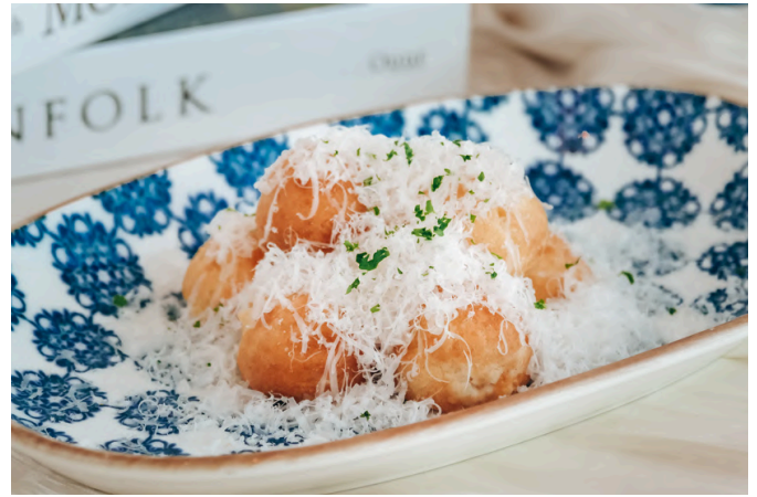
奶酪泡芙 (G, E, D) 320 格鲁耶尔奶酪 / 埃曼塔尔奶酪 / 蓝纹奶酪 / 肉豆蔻