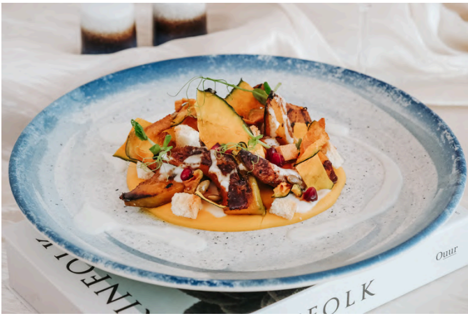
烤南瓜 (V, D, N) 450 烤南瓜 / 南瓜泥 / 酸奶酱 / 混合香料 / 南瓜籽 / 混合微型蔬菜 / 石榴 / 面包丁 / 野香蜂蜜