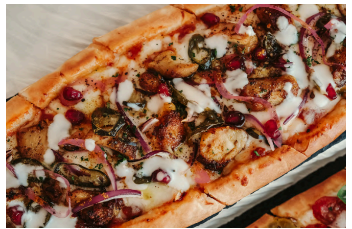
烤鸡扁面包 (G, D) 590 烤鸡 / 番茄酱 / 葱 / 墨西哥辣椒 / 辣椒粉 / 马苏里拉奶酪 / 蒜蓉酸奶 / 石榴

VG - Vegan (素食主义者) | V - Vegetarian (素食) | G - Contains Gluten (含有麸质) | E - Contains Egg (含鸡蛋) | D - Contains Dairy (包含乳制品) B - Contains Beef (含牛肉) | P - Contains Pork (含有猪肉) | S - Contains Fish/Shellfish (包含鱼类/贝类) | A - Contains Alcohol (含有酒精) N - Contains Nuts/Seeds (含有坚果/种子) | 🌶️ - Spicy (辣味菜) | 🌿 - Recommended (主厨推荐)