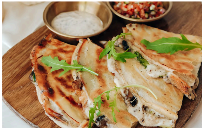
松露油炸玉米粉饼 (V, G, D) 420 蘑菇 / 马苏里拉奶酪 / 松露蛋黄酱 / 黄瓜番茄莎莎酱