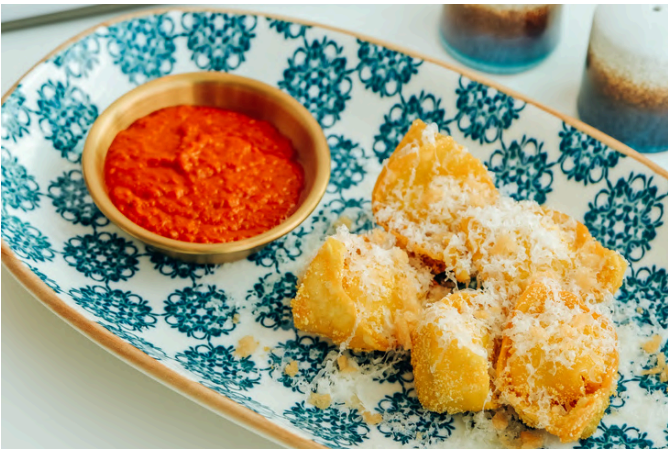
炸蟹肉饺子 (G, E, D, S, 🌶️) 350 帕尔马干酪 / 蟹肉 / 意大利乳清干酪 / 辣番茄酱