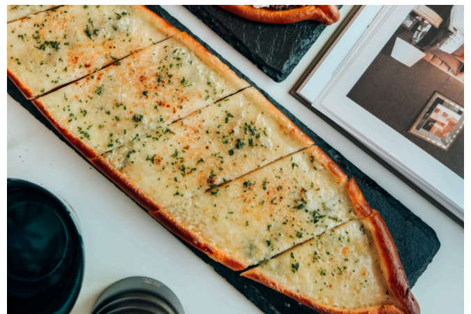
四块芝士面包 (V, G, D) 590 塔菜吉奥 / 马苏里拉奶酪 / 烟熏斯卡莫扎 / 戈贡佐拉干酪