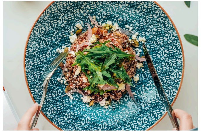
招牌沙拉 (V, D, N) 390 烤甜菜根 / 南瓜 / 菊芋 / 藜麦 / 菲达奶酪 / 葵花籽 / 松子 / 蜂蜜白香醋酱