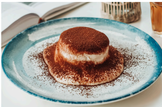
提拉米苏 (V, G, E, D, A) 280 马斯卡彭奶酪 / 有机鸡蛋 / 萨沃伊饼干 / 意式浓缩咖啡 / 杏仁酒