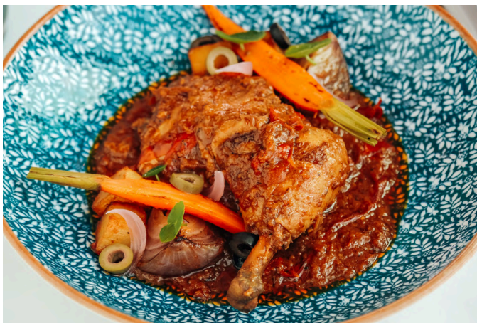
西班牙炖鸡 (🌶️) 650 鸡腿 / 橄榄 / 土豆 / 辣番茄酱