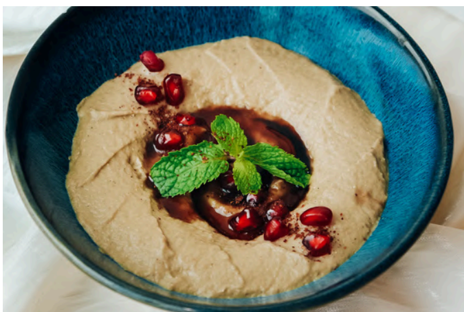
巴巴加诺什 (V, D) 🌿 270 烤茄子 / 大蒜 / 芝麻酱 / 特级初榨橄榄油