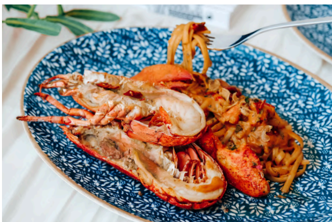
奶油辣龙虾扁面条 (G, D, S, A, 🌶️) 半只 1,000 | 整只 1,900 加拿大龙虾 / 番茄酱 / 奶油 / 香葱 / 辣椒 / 大蒜