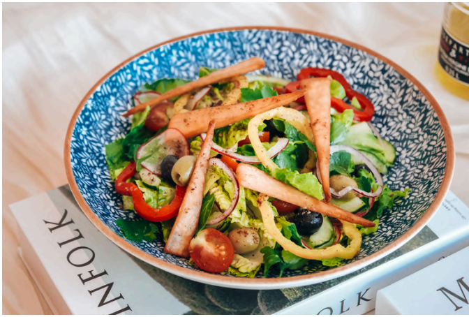
黎巴嫩法图什沙拉 (VG, G) 390 皮塔饼 / 小黄瓜 / 樱桃番茄 / 黄瓜 / 红萝卜 / 辣椒 / 葱 / 薄荷 / 欧芹 / 漆树和柠檬醋汁