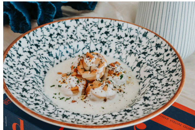
中东肉饺子 (G, D, N) 390

黄尾鲷鱼 / 茴香 / 烟熏辣椒粉 / 刺山柑 / 柠檬 / 松子 / 特级初榨橄榄油