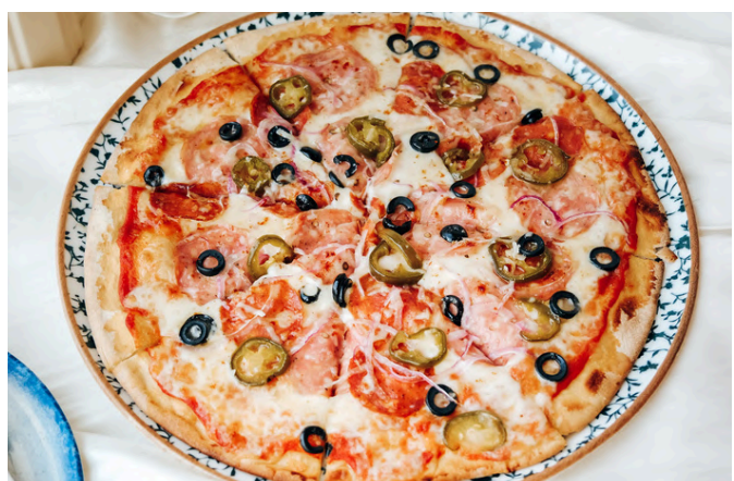
香辣萨拉米香肠 (G, D, P, 🌶️ 🌿) 590

虎虾 / 鱿鱼 / Nduja 香肠 / 贻贝 / 马苏里拉奶酪 / 烟熏斯卡莫扎 / 新鲜番茄酱