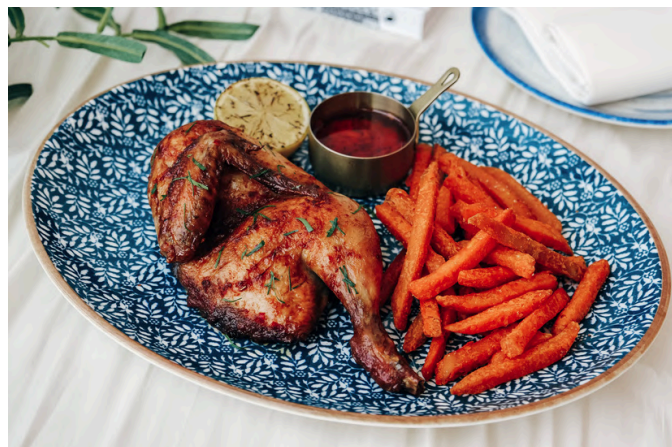
皮里皮里烤鸡 (🌿) 720 香草鸡 / 柠檬 / 红薯条 / 红辣椒 / 香菜