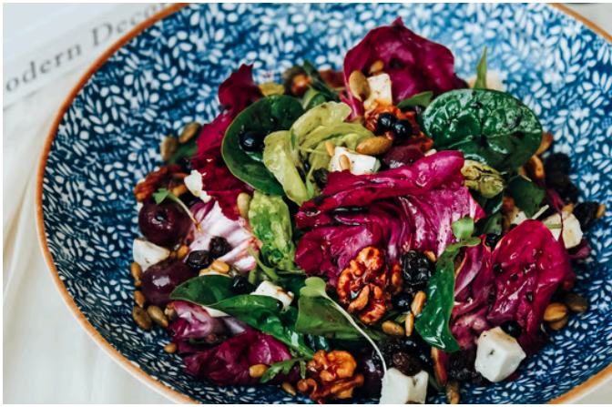
菊苣与戈贡佐拉沙拉 (V, D, N) 390 生菜 / 芝麻菜 / 核桃 / 葵花籽 / 南瓜籽 / 香醋