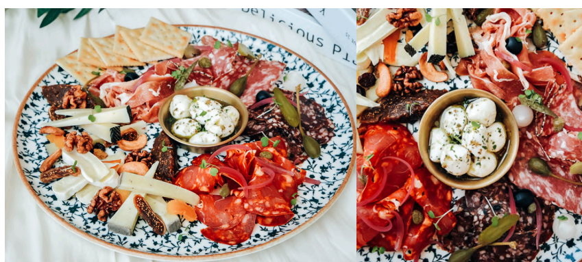
冷盘拼盘 (G, D, P, N) 990 “MAISON LOSTE” 手工熟肉 伊比利亚香肠 / 干香肠 / 伊比利亚火腿 / 胡椒饼 / 雷布洛申奶酪 / 曼切戈奶酪 / 松露调味的Sottocenere奶酪 / 小奶酪球