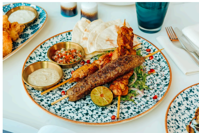
混合烤肉串 (G, D) 600 2 串鸡肉 / 1 串羊肉 / 皮塔饼 / 蔬菜/酸奶 / 芝麻酱

VG – Vegan (素食主义者) | V – Vegetarian (素食) | G – Contains Gluten (含有麸质) | E – Contains Egg (含鸡蛋) | D – Contains Dairy (包含乳制品) B – Contains Beef (含牛肉) | P – Contains Pork (含有猪肉) | S – Contains Fish/Shellfish (包含鱼类/贝类) | A – Contains Alcohol (含有酒精) N – Contains Nuts/Seeds (含有坚果/种子) | 🌿 – Spicy (辣味菜) | 🌿 – Recommended (主厨推荐)