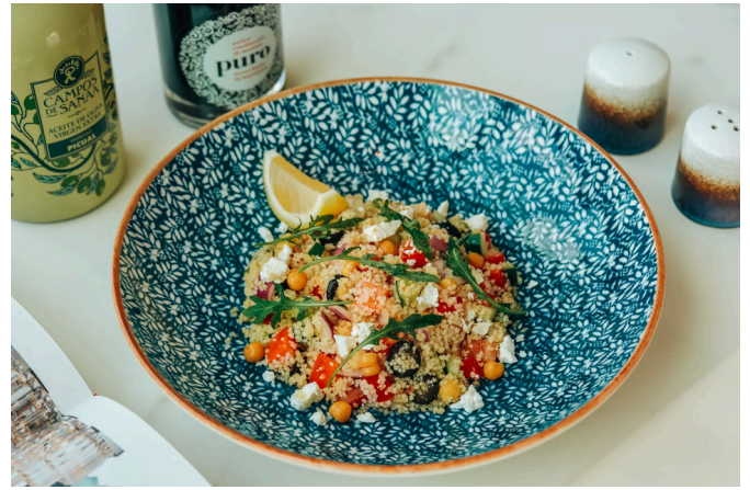
摩洛哥蒸粗麦粉沙拉 (V, G, D) 390 橄榄 / 黄瓜 / 番茄 / 洋葱 / 鹰嘴豆 / 薄荷 / 罗勒 / 羊乳酪 / 柠檬酱