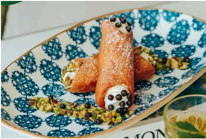
西西里奶酪卷 (V, G, E, D, N) 290 里科塔奶酪 / 黑巧克力 / 蜜饯橙皮 / 开心果