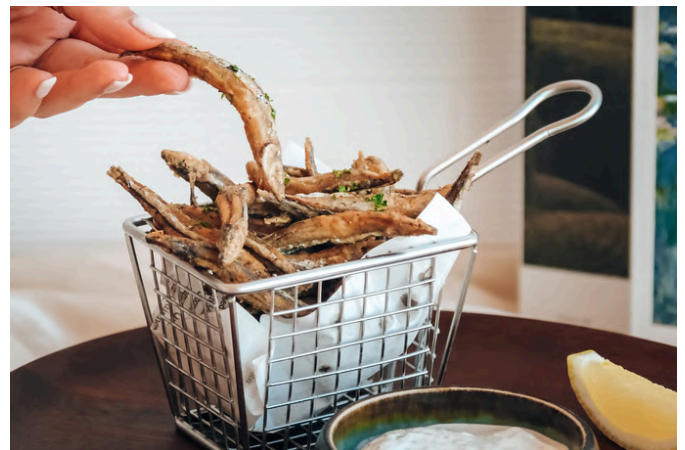
炸凤尾鱼 (G, D, S) 🌿 320 凤尾鱼 / 柠檬 / 辣根酸奶酱

VG - Vegan (素食主义者) | V - Vegetarian (素食) | G - Contains Gluten (含有麸质) | E - Contains Egg (含鸡蛋) | D - Contains Dairy (包含乳制品) B - Contains Beef (含牛肉) | P - Contains Pork (含有猪肉) | S - Contains Fish/Shellfish (包含鱼类/贝类) | A - Contains Alcohol (含有酒精) N - Contains Nuts/Seeds (含有坚果/种子) | 🌶️ - Spicy (辣味菜) | 🌿 - Recommended (主厨推荐)