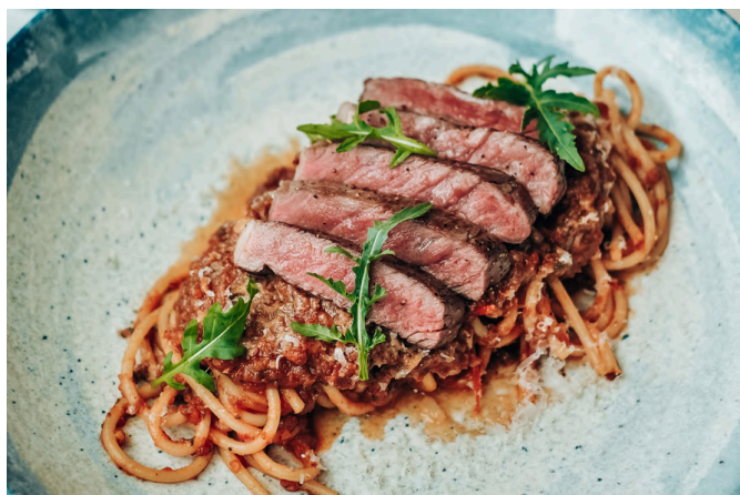
烤牛肉炖牛肉意大利面 (G, D, B, A) 720 黑安格斯牛里脊肉 / 炖牛肉 / 番茄酱 / 野芝麻菜 / 帕尔马干酪