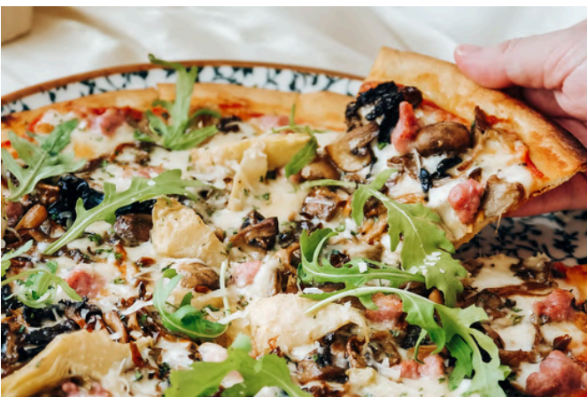
蘑菇和香肠 (G, D, P) 650 意大利香肠 / 野生蘑菇 / 野生芝麻菜 / 塔雷吉欧奶酪 / 帕尔马干酪 / 马苏里拉奶酪