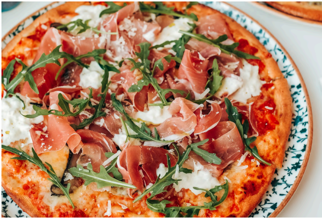
比安卡火腿 (G, D, P) 650 蘑菇 / 番茄酱 / 意式奶酪 / 芝麻菜 / 马苏里拉奶酪 / 帕尔马干酪 / 火腿/松露油