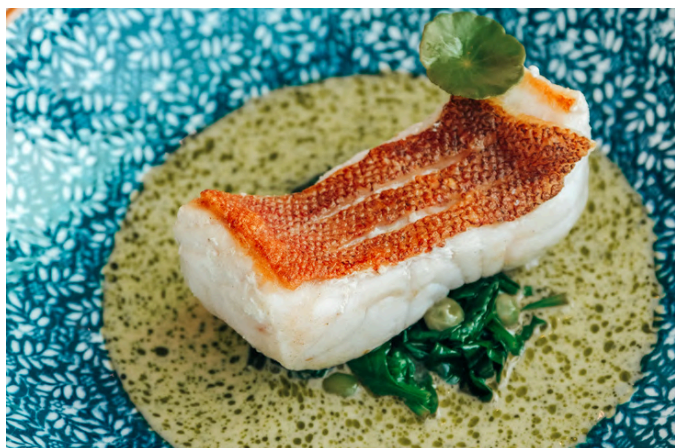
加利西亚风味大石斑鱼 (D, S, A, N) 890 烟熏辣椒粉 / 嫩菠菜 / 青豆 / 白葡萄酒奶油酱