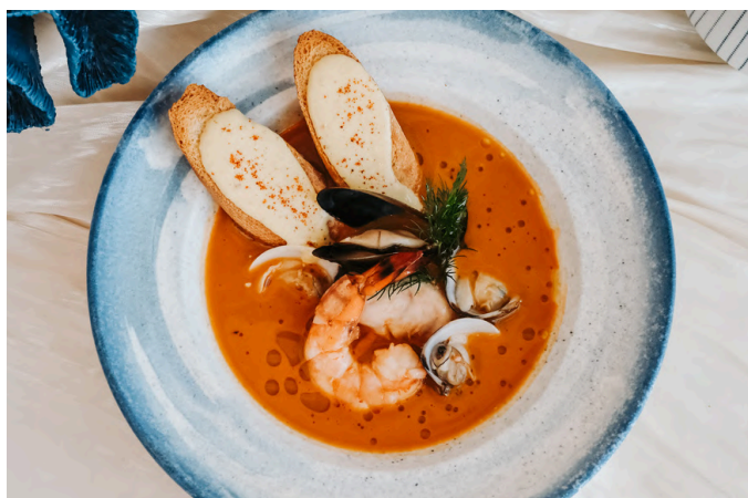
法式海鲜汤 (G, E, S, A) 390 大比目鱼 / 蛤蜊 / 贻贝 / 虎虾 / 藏红花