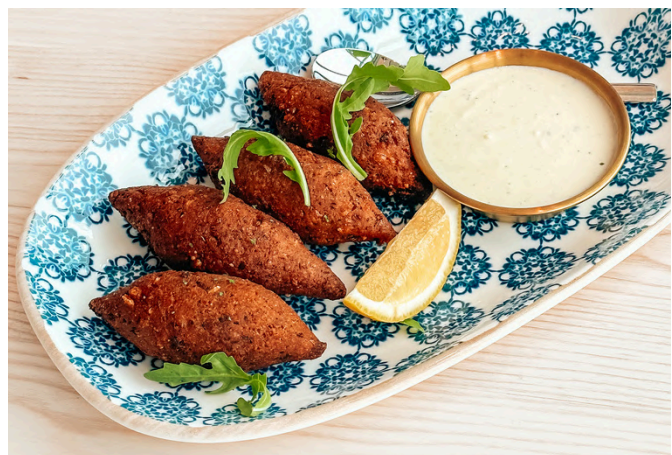
基贝 (G, D, N) 340 羊肉末 / 小麦碎/松子 / 蒜蓉酸奶酱