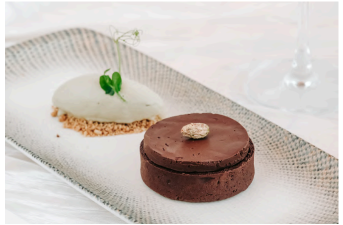
开心果巧克力挞 (V, G, E, D, N) 350 卡塔伊菲 / 开心果 / 黑巧克力 / 开心果冰淇淋