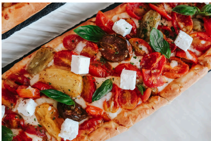
传家宝番茄扁面包 (V, G, D) 490