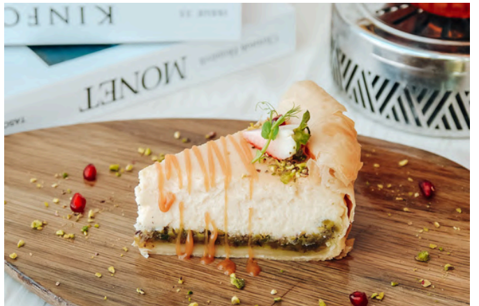
巴克拉瓦奶酪蛋糕 (V, G, E, D, N) 350 薄饼 / 开心果 / 野花蜂蜜 / 玫瑰花瓣

VG - Vegan (素食主义者) | V - Vegetarian (素食) | G - Contains Gluten (含有麸质) | E - Contains Egg (含鸡蛋) | D - Contains Dairy (包含乳制品) B - Contains Beef (含牛肉) | P - Contains Pork (含有猪肉) | S - Contains Fish/Shellfish (包含鱼类/贝类) | A - Contains Alcohol (含有酒精) N - Contains Nuts/Seeds (含有坚果/种子) | 🌶️ - Spicy (辣味菜) | 🌿 - Recommended (主厨推荐)