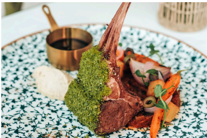
羊肉阿涅洛 (A, N) 1,290 开心果皮 / 茄子馅 / 土豆 / 羊肉汁