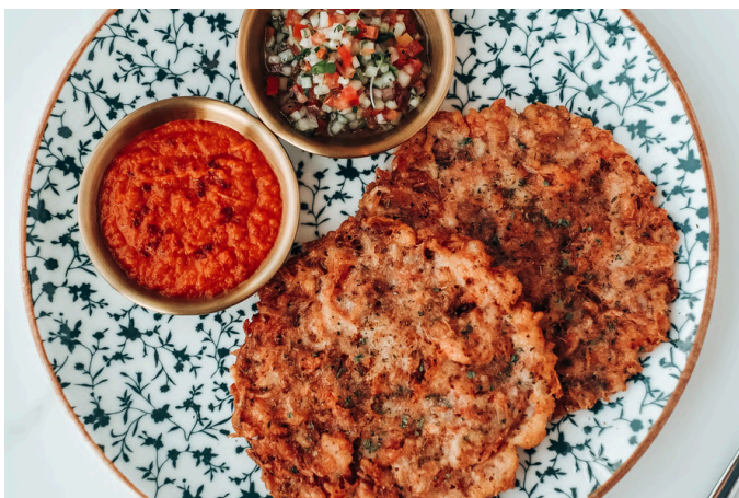
虾饼 (G, S, 🌶️) 330 辣番茄酱 / 黄瓜番茄莎莎酱 / 虾饼