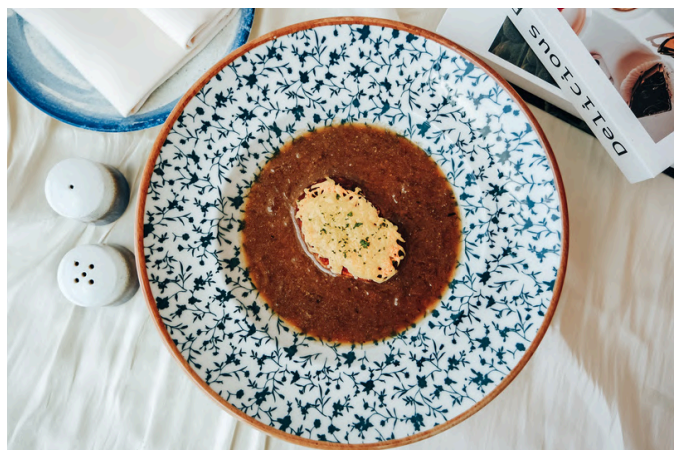
托斯卡纳洋葱汤 (V, G, A, N) 310 r红洋葱 / 杏仁 / 肉桂 / 佩科里诺奶酪 / 鸡汤