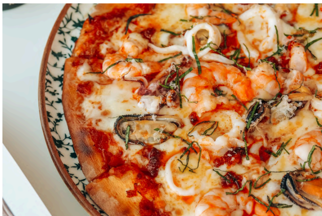
海鲜 (G, D, S, 🌶️) 650

虎虾 / 鱿鱼 / Nduja 香肠 / 贻贝 / 马苏里拉奶酪 / 烟熏斯卡莫扎 / 新鲜番茄酱