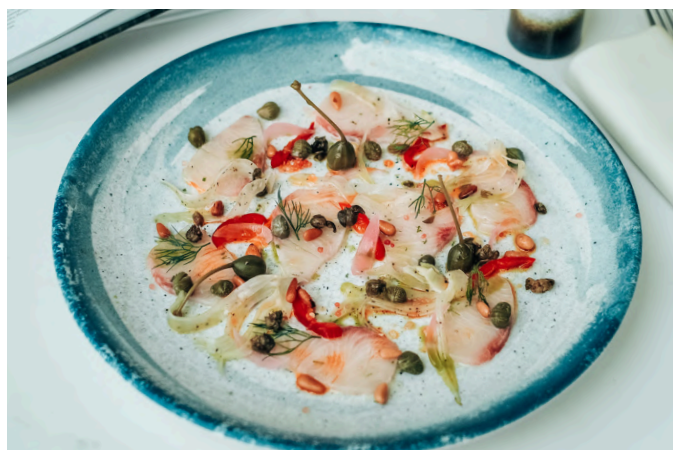
生腌鱼片 (S, N) 690

黄尾鲷鱼 / 茴香 / 烟熏辣椒粉 / 刺山柑 / 柠檬 / 松子 / 特级初榨橄榄油