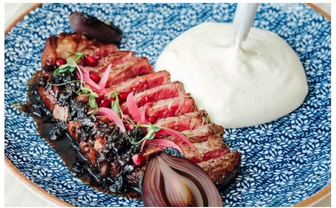
安格斯肋眼牛排 (D,B) 1,600 安格斯牛里脊肉 1,400 土豆泡沫 / 红烧青葱 / 石榴酱