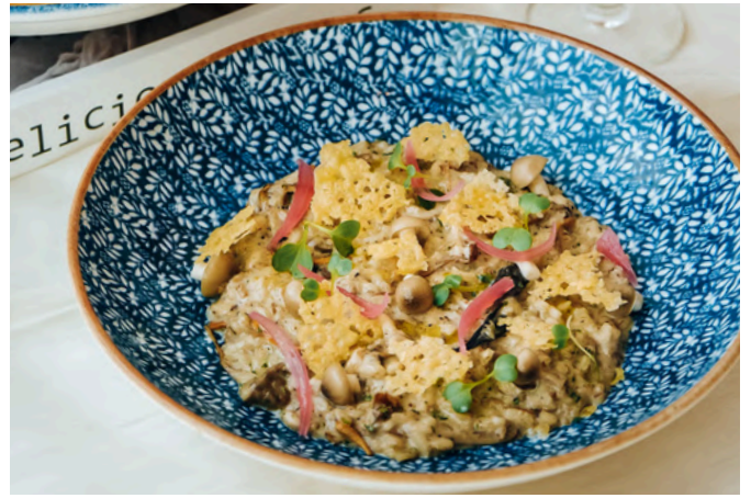
蘑菇烩饭 (G, D, N) 790 野生蘑菇 / 帕尔马干酪 / 马斯卡彭 / 芝麻菜 / 黑松露