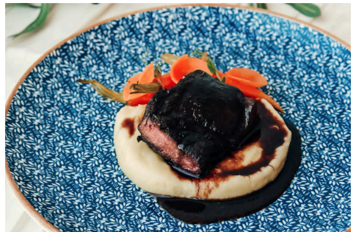
红烧牛脸肉 (D, B, A) 990 胡萝卜 / 阿利戈奶酪土豆 / 红酒汁

VG - Vegan (素食主义者) | V - Vegetarian (素食) | G - Contains Gluten (含有麸质) | E - Contains Egg (含鸡蛋) | D - Contains Dairy (包含乳制品) B - Contains Beef (含牛肉) | P - Contains Pork (含有猪肉) | S - Contains Fish/Shellfish (包含鱼类/贝类) | A - Contains Alcohol (含有酒精) N - Contains Nuts/Seeds (含有坚果/种子) | 🌶️ - Spicy (辣味菜) | 🌿 - Recommended (主厨推荐)