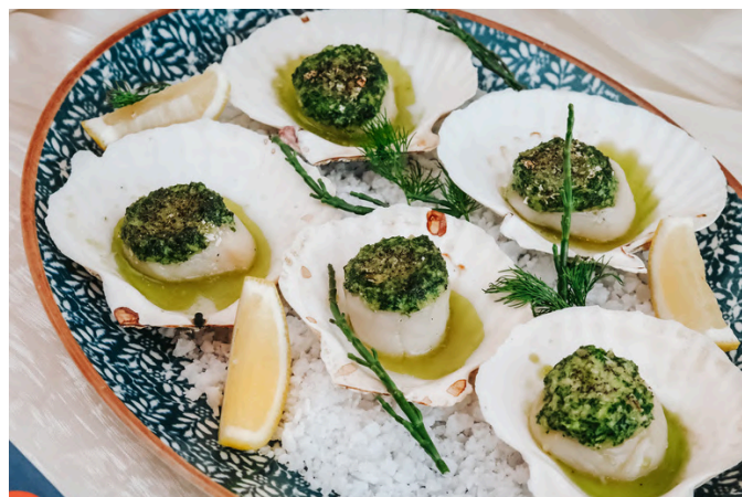
烤扇贝 (D, S, A) 690