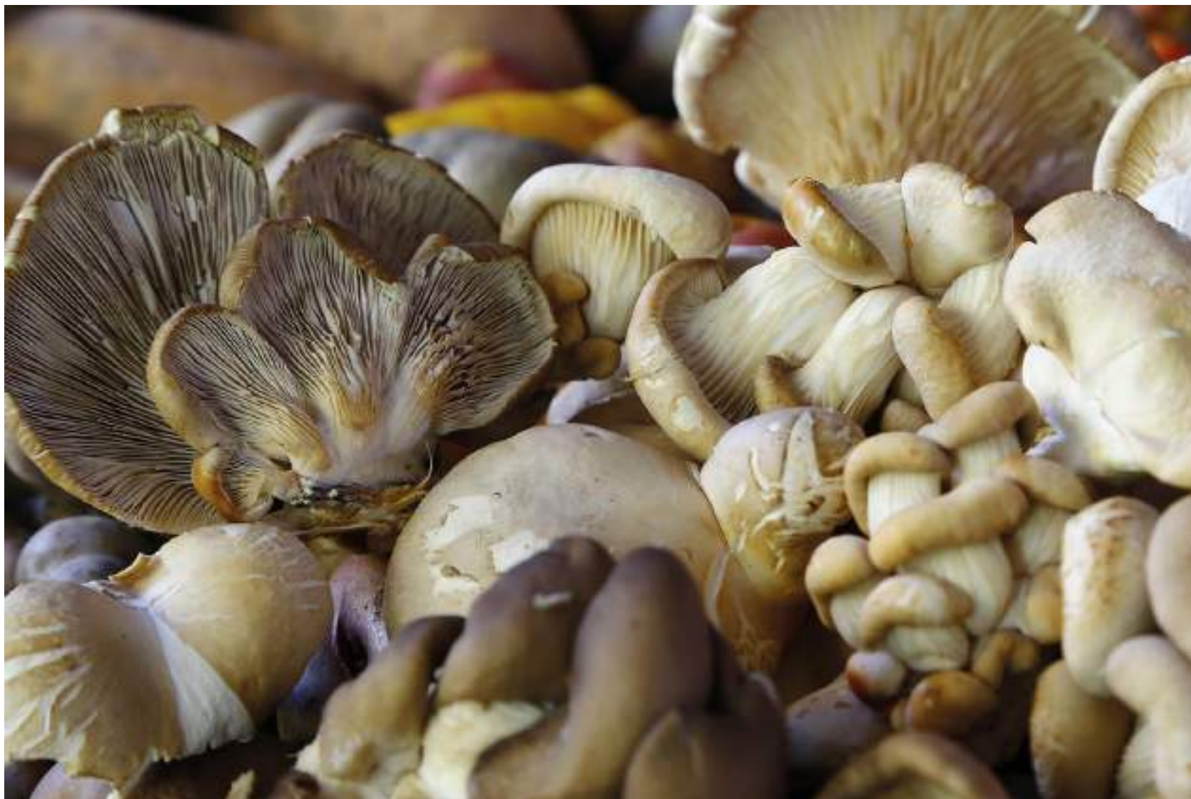
Os cogumelos tipo Ostras

Associação Conchacalla Distrito: Izcucacha Provincia: Anta Altitude: 3345m