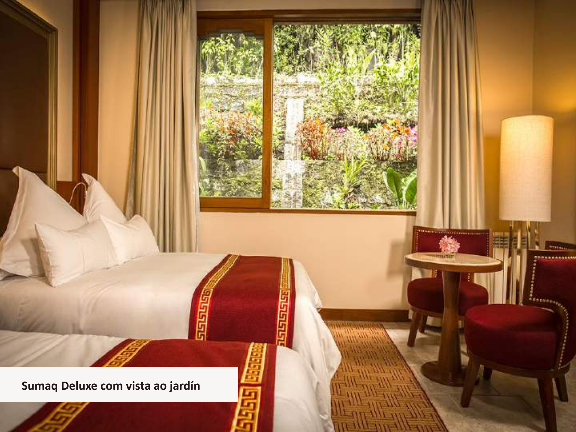
Sumaq Deluxe com vista ao jardim