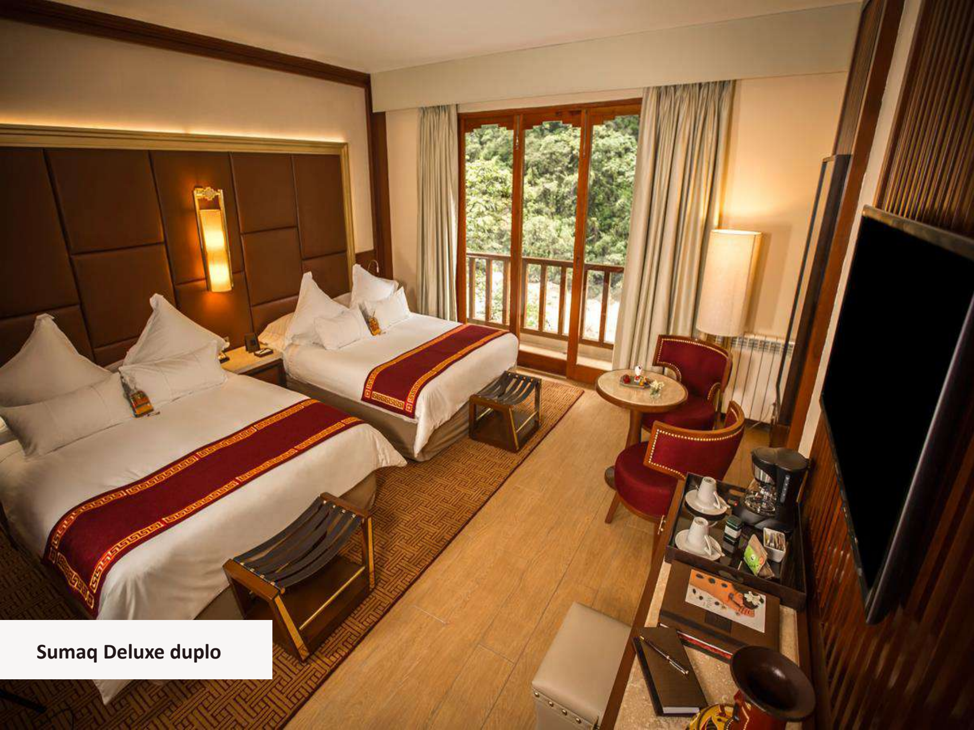
Sumaq Deluxe duplo