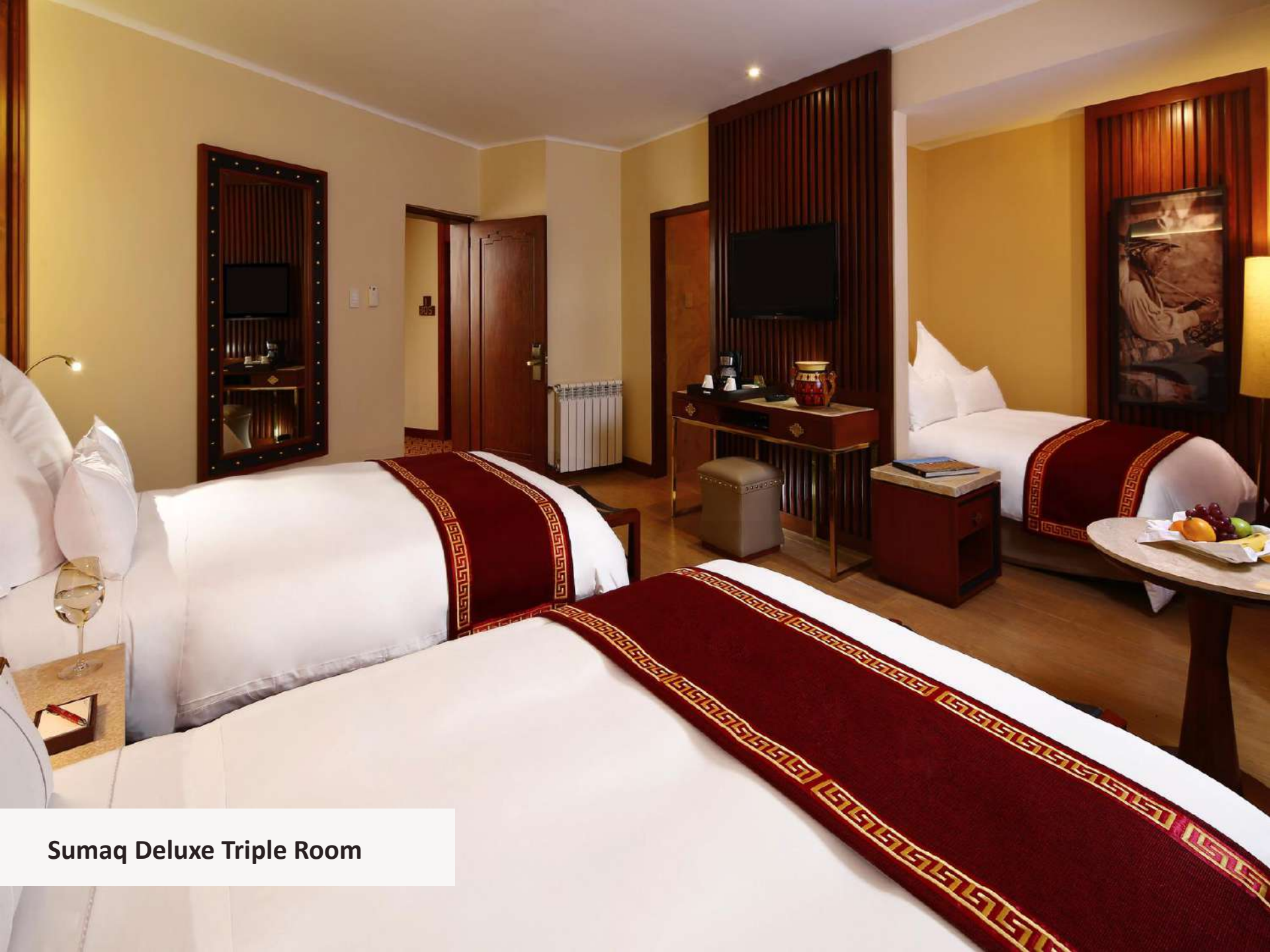
Sumaq Deluxe Triple Room