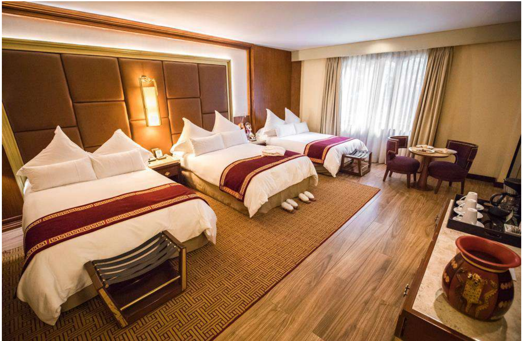
Sumaq Deluxe Familiar

4 confortáveis camas full size. Ideal para 8 pessoas: 4 adultos e 4 crianças.