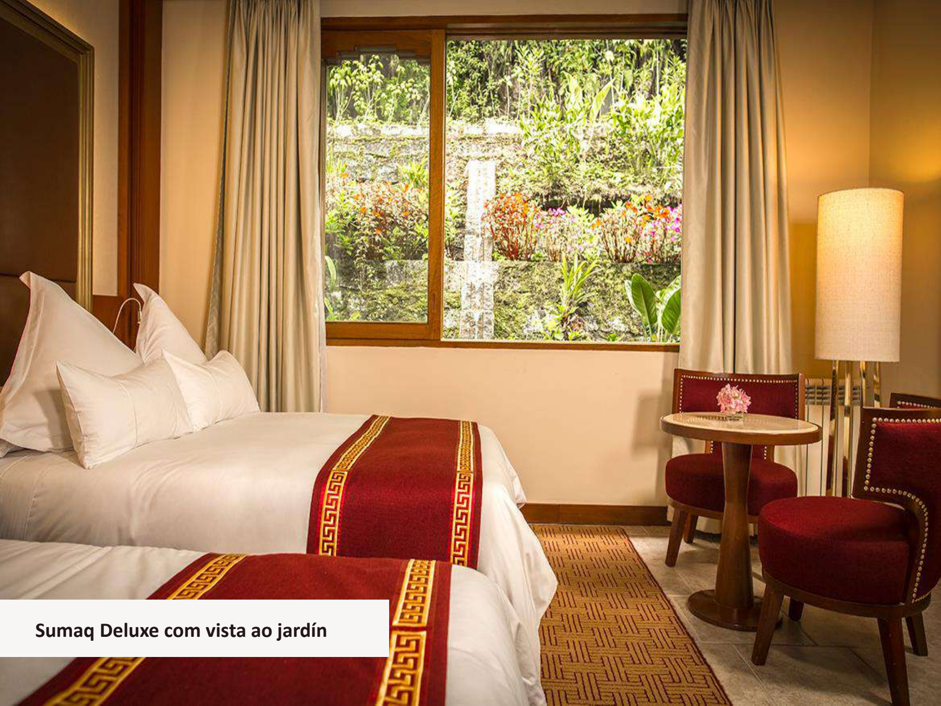
Sumaq Deluxe com vista ao jardim