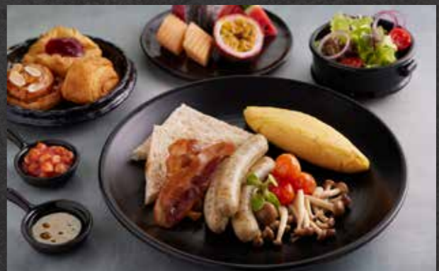
FULL AMERICAN BREAKFAST 🍷 🥗 299 two farm eggs cooked any style, bacon, sausage, sautéed mushrooms, grilled tomatoes, toast, baked beans, fresh baked pastries, fresh salad and mixed fruit ชุดอาหารเช้าสไตล์อเมริกัน ไข่ 2 ฟอง ปรุงสุกตามสั่ง เสิร์ฟพร้อมเบคอน ไส้กรอก เห็ดผัด มะเขือเทศย่าง ขนมปังปิ้ง ถั่วอบในซอสมะเขือเทศ ทรักร้าขนมปังอบ สลัดผัก และผลไม้รวม

🍷 Pork | 🥗 Healthy | 🥜 Contains Nuts | 🌱 Vegetarian | 🌶️ Spicy