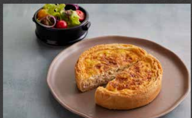
QUICHE LORRAINE 🍷 259 traditional quiche with onion and bacon served with fresh salad คิซหัวหอม และเบคอนสไตล์ดั้งเดิม เสิร์ฟพร้อมสลัดผัก