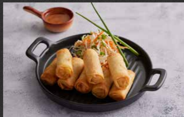
POH PIA PAK 🌱 180 vegetable spring rolls with plum sauce ปอเปี๊ยะผัก เสริฟพร้อมซอสบ๊วย