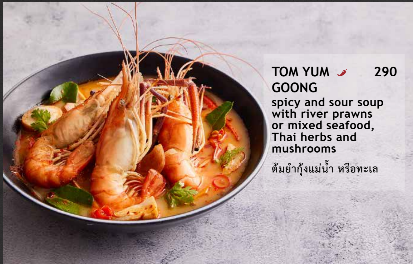
TOM YUM GOONG 🌶️ 290 spicy and sour soup with river prawns or mixed seafood, Thai herbs and mushrooms ต้มยำกุ้งแม่น้ำ หรือทะเล