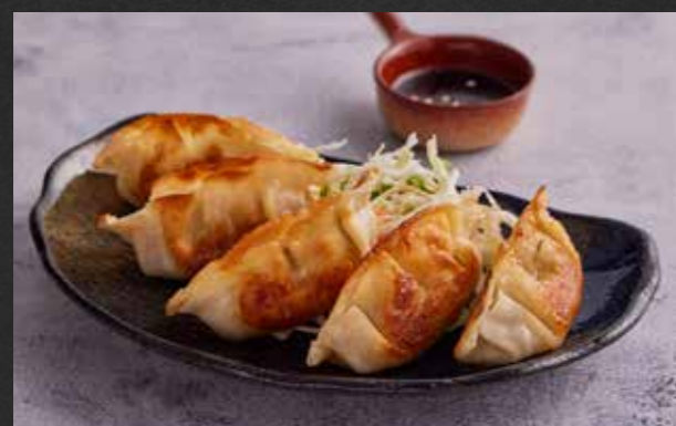
GYOZA 🐷 190 Japanese pork dumplings sprinkled with sesame seeds and served with shoyu sauce เกี๊ยวซ่าหมู โรยงาขาวเสริฟพร้อมซอสโชยุ