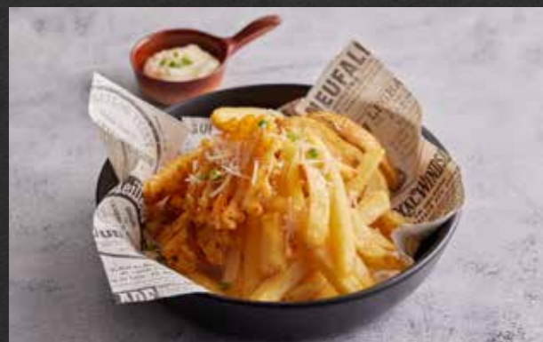
POTATO FRIES 3 WAYS 175 French fries, potato wedges and waffle fries with Parmesan cheese dip มันฝรั่งทอด 3 แบบ เสริฟพร้อมชีสพาร์เมซาน