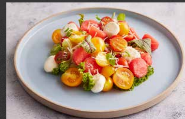
CHERRY TOMATO SALAD 🌱 210 fresh mixed cherry tomatoes, watermelon, mozzarella cheese, basil and Parmesan cheese, served with bread & butter สลัดมะเขือเทศเชอร์รี่ เสริฟพร้อมแตงโม ชีสมอสซาเรลล่า ไบโระพาชีสพาร์เมซาน และขนมปังเนย