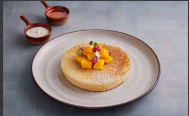
VANILLA PANCAKE 🍷 169 vanilla milk pancake with mango, honey, whipped ricotta cream and maple syrup วานิลลาแพนเค้ก เสิร์ฟพร้อมมะม่วง น้ำผึ้ง วิปครีมและน้ำเชื่อมเมเปิ้ล