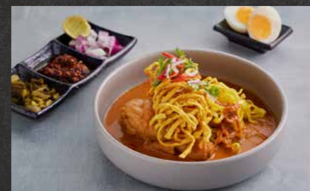
NORTHERN TREAT BREAKFAST 🍷 199 Northern Thai yellow curry noodles with chicken and boiled egg ชุดอาหารเช้าเชียงใหม่ ข้าวซอยไก่ เสิร์ฟพร้อมไข่ต้ม