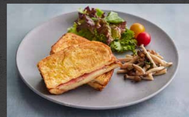
HAM & BRIE CHEESE FRENCH TOAST SANDWICH 🍷 199 Swiss zopf bread, ham and Brie cheese served with sautéed mushrooms ขนมปังซูปไซส์สไตล์ฝรั่งเศสใส่แฮม และบริชีส เสิร์ฟพร้อมเห็ดผัด