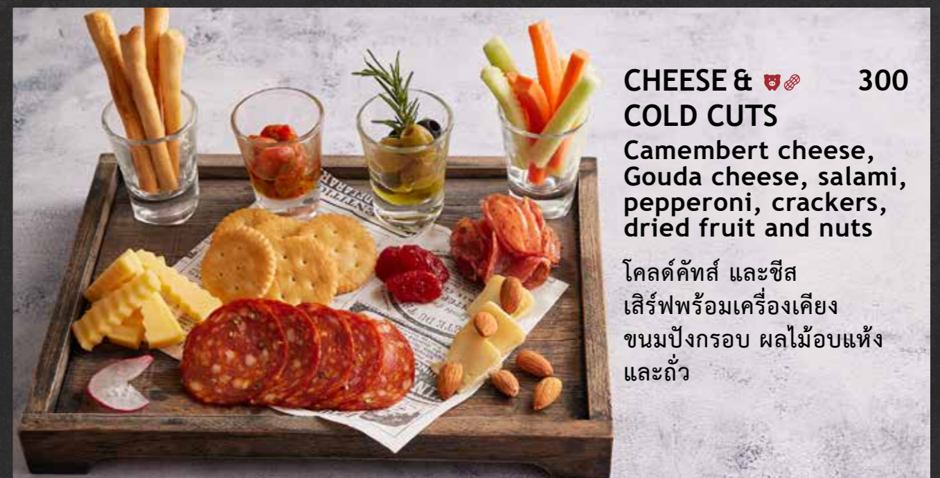
CHEESE & COLD CUTS 🐷 300 Camembert cheese, Gouda cheese, salami, pepperoni, crackers, dried fruit and nuts โคลด์คัทส และชีส เสริฟพร้อมเครื่องเคียง ขนมปังกรอบ ผลไม้อบแห้ง และถั่ว

🐷 Pork | 🌱 Healthy | 🥜 Contains Nuts | 🌿 Vegetarian | 🌶️ Spicy