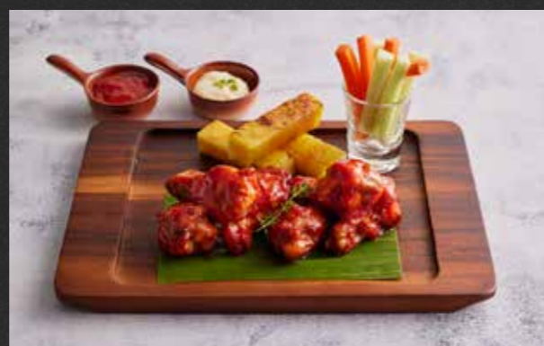
BUFFALO WINGS 🌶️ 190 crispy Buffalo chicken wings served with BBQ sauce and blue cheese dip ไก่ทอด เสริฟพร้อมซอสบาร์บีคิว และซอสบลูชีส