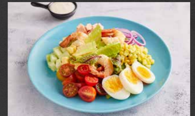
EASTIN CHEF'S SALAD 🐷 200 Chiang Mai farm salad leaves, cucumber, tomato, radish, onion, prawns, boiled egg, ham, Cheddar cheese and corn, served with bread & butter อีสตินเชฟสลัด ผักสลัดสดจากฟาร์มเชียงใหม่ แตงกวา มะเขือเทศ ทรัฟเฟิล หัวหอม เสริฟพร้อมกุ้ง ไข่ต้ม แฮม ชีสเชดดาร์ ข้าวโพดหวาน และขนมปังเนย