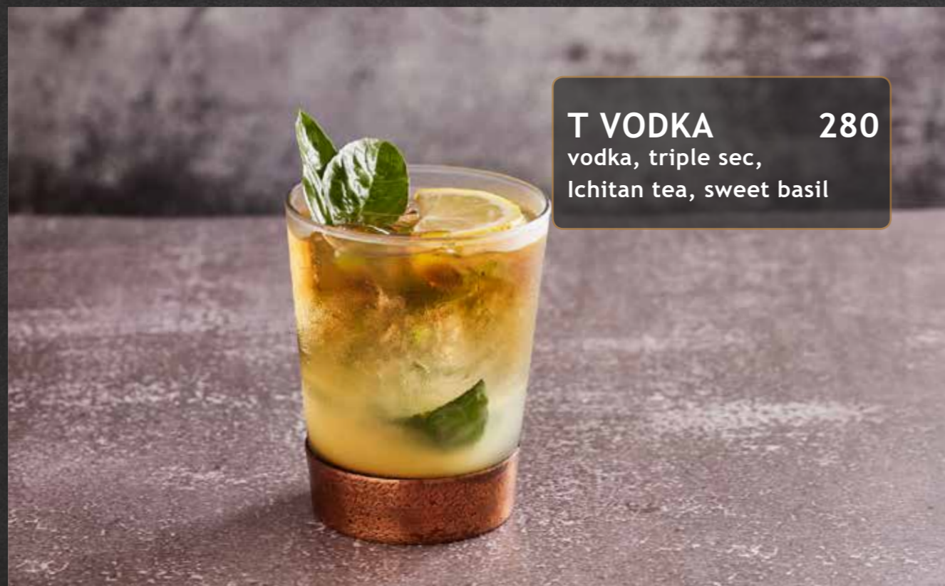
T VODKA 280 vodka, triple sec, Ichitan tea, sweet basil