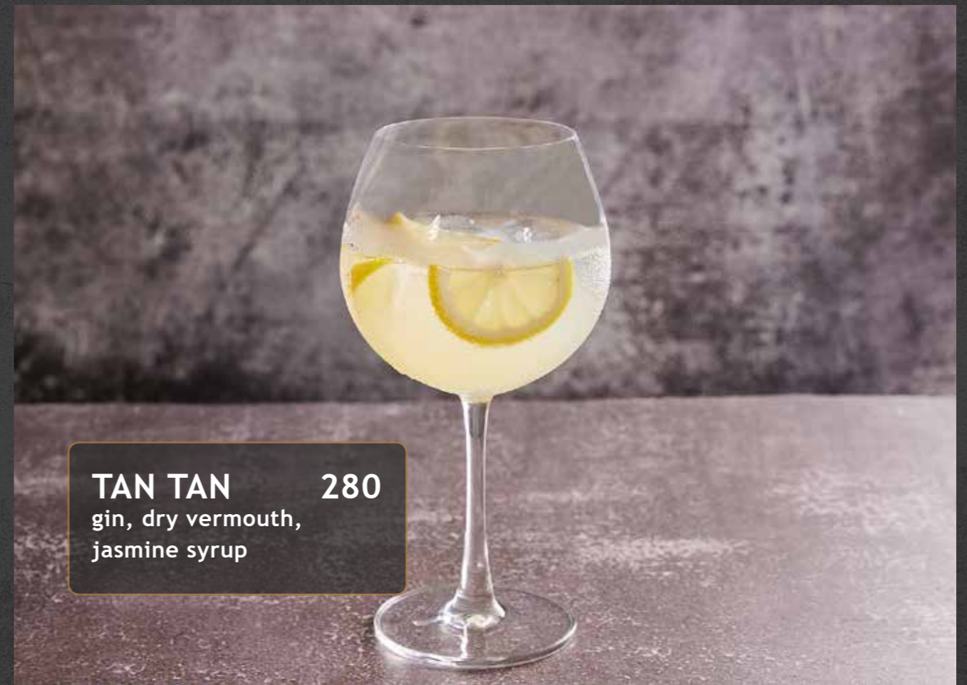
TAN TAN 280 gin, dry vermouth, jasmine syrup