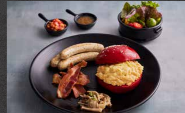
THE BIG BOY 🍷 🥗 259 scrambled eggs and Cheddar cheese on a bun served with bacon, sausage, sautéed mushrooms, baked beans and fresh salad ไข่คนชีสเชดดาร์ เสิร์ฟบนขนมปัง พร้อมด้วยเบคอน ไส้กรอก เห็ดผัด ถั่วอบในซอสมะเขือเทศ และสลัดผัก