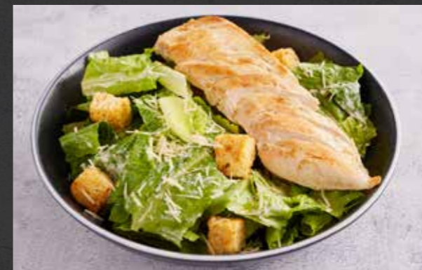
CAESAR SALAD 🐷 200 romaine, iceberg and radicchio tossed with traditional Caesar dressing and topped with grilled chicken and bacon, served with bread & butter ซีซาร์สลัด เสริฟพร้อมไก่ย่าง เบคอน และขนมปังเนย