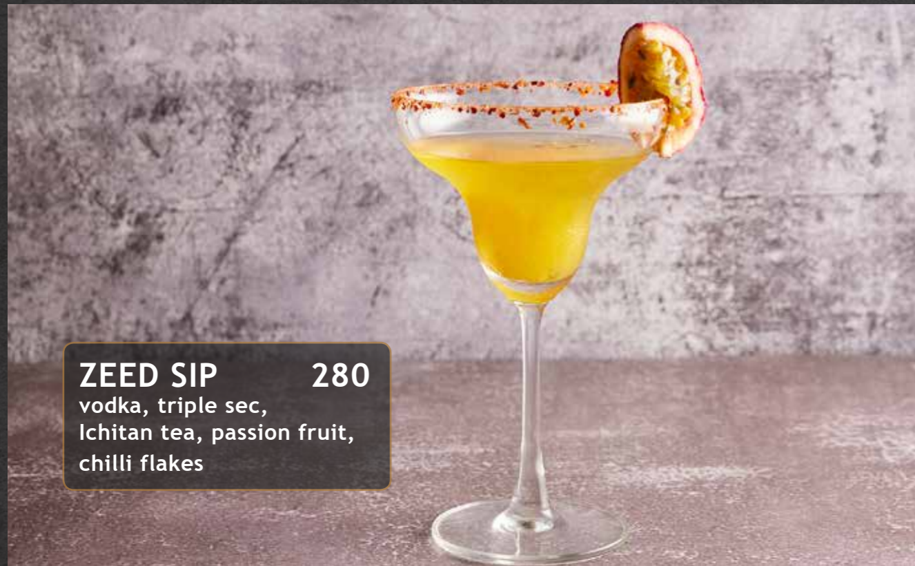
ZEED SIP 280 vodka, triple sec, Ichitan tea, passion fruit, chilli flakes