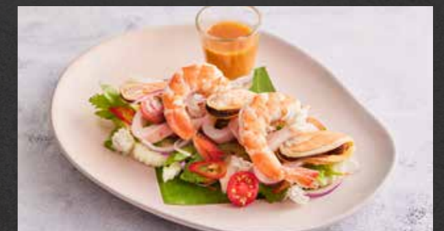
YAM RUAM MIT TALAY 🌶️ 250 spicy Thai mixed salad with prawns, squid, New Zealand mussel, minced pork, tomato, mushroom, chilli and lime ยำรวมมิตรทะเล