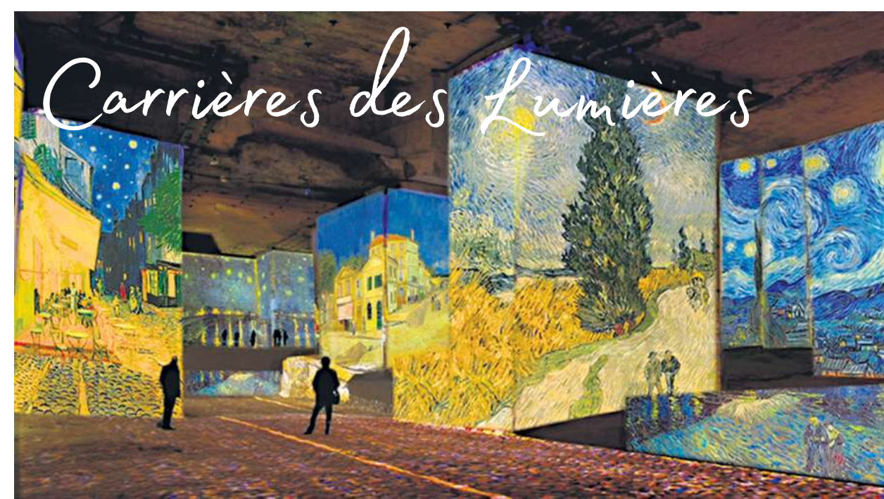
Carrières des Lumières