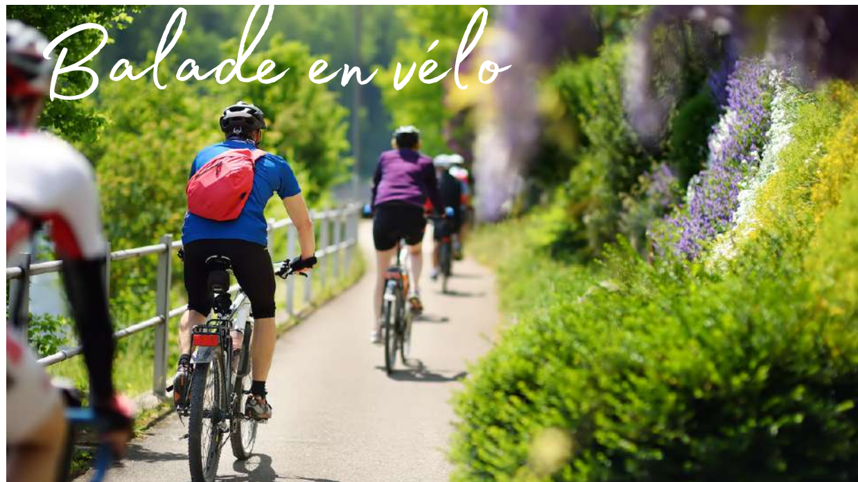
Balade en vélo