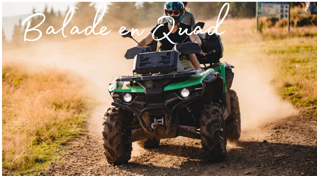
Balade en Quad