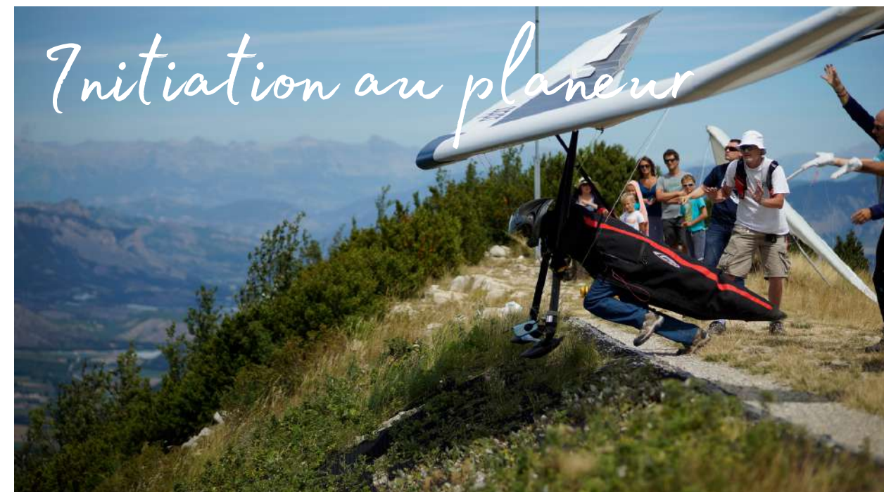
Initiation au planeur