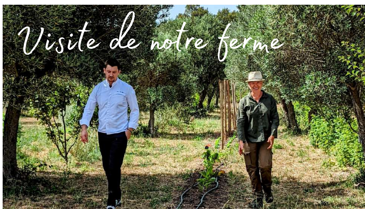
Visite de notre ferme