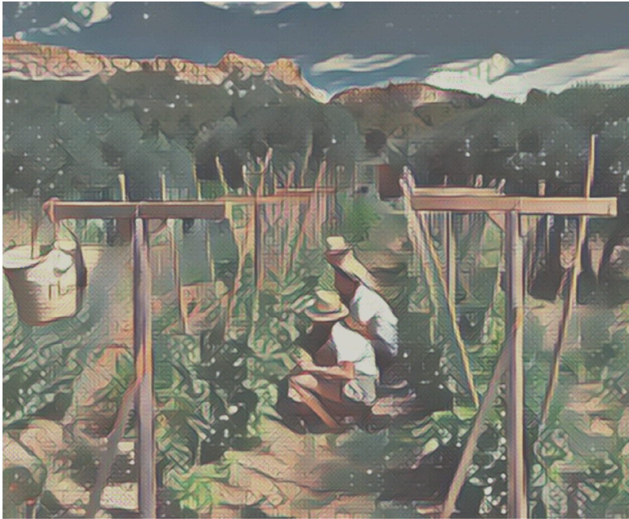
JARDIN EN PERMACULTURE DOMAINE DE MANVILLE