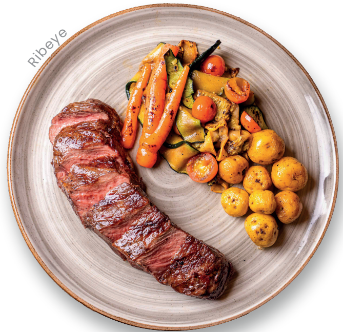
Lomo Mantequilla Especias