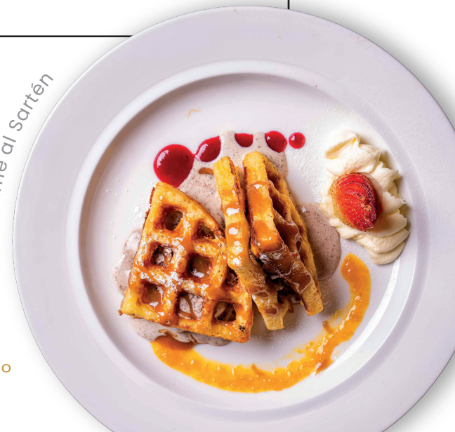
Waffle al Sartén

Nuestros precios incluyen impuesto al consumo