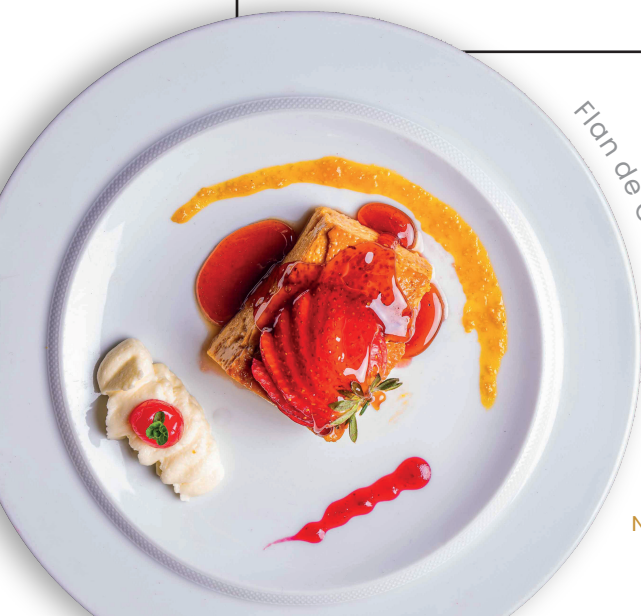
Flan de Caramelo