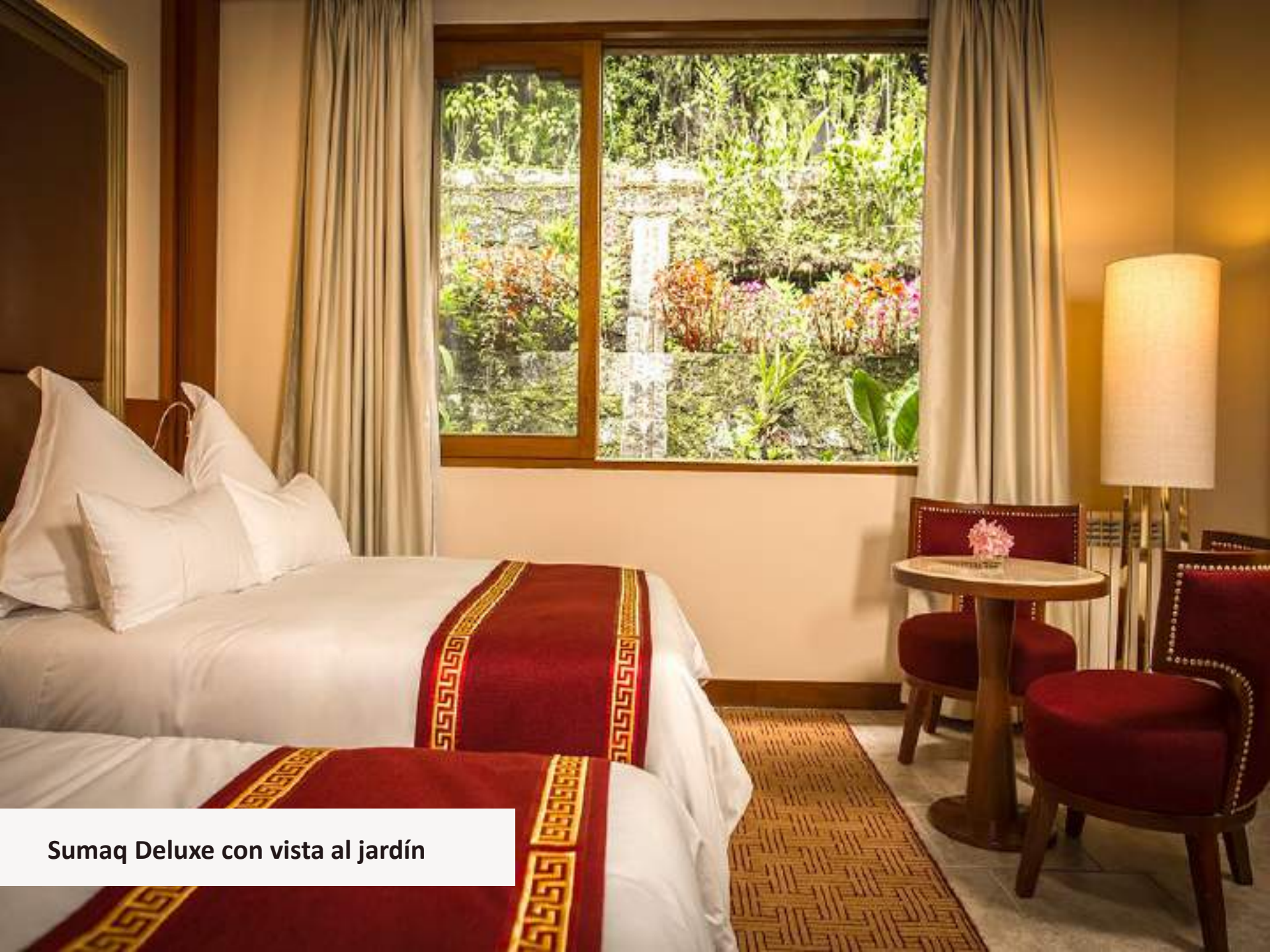
Sumaq Deluxe con vista al jardín