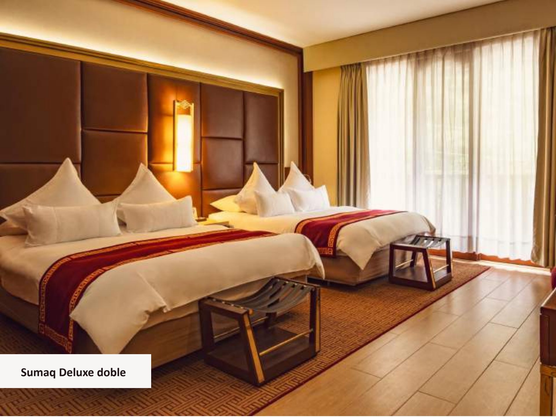
Sumaq Deluxe doble