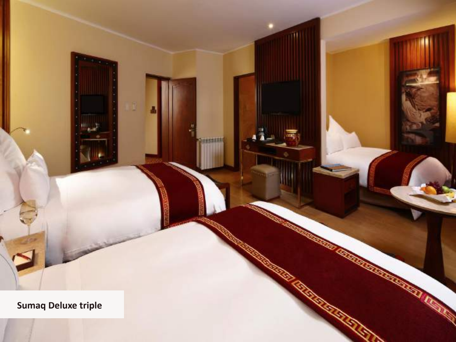
Sumaq Deluxe triple