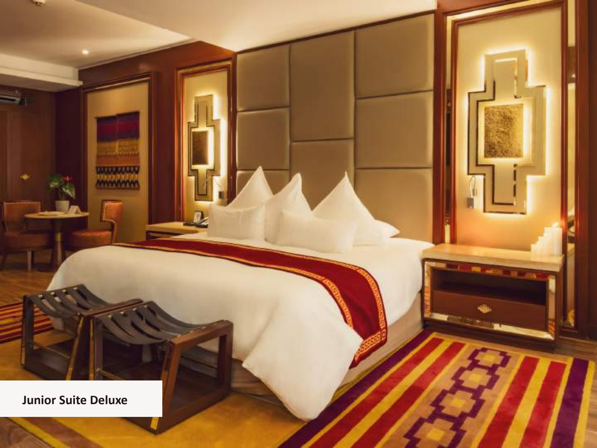
Junior Suite Deluxe