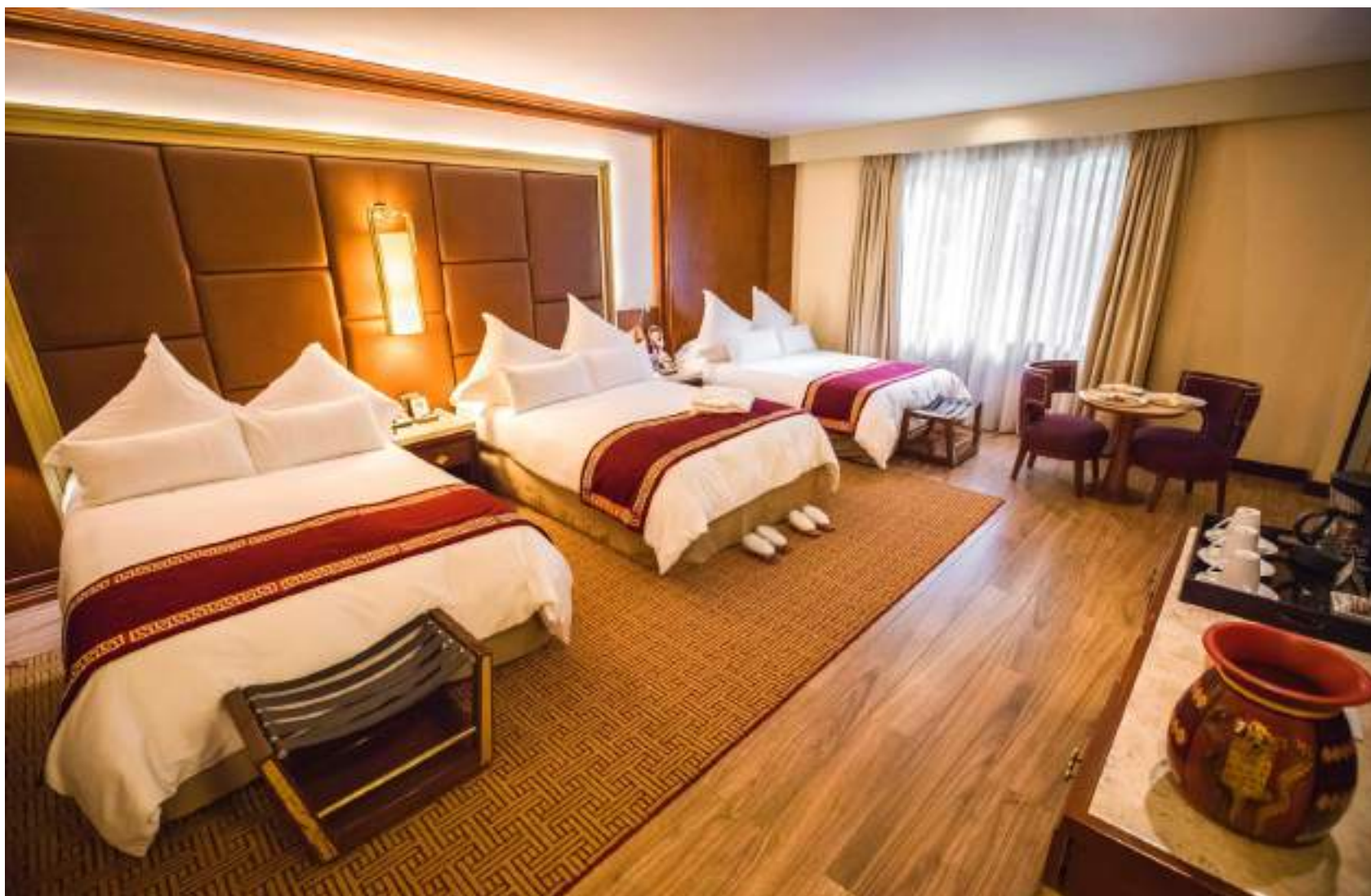
Sumaq Deluxe familiar

4 confortables camas full size. Ideal para 8 personas: 4 adultos y 4 niños.