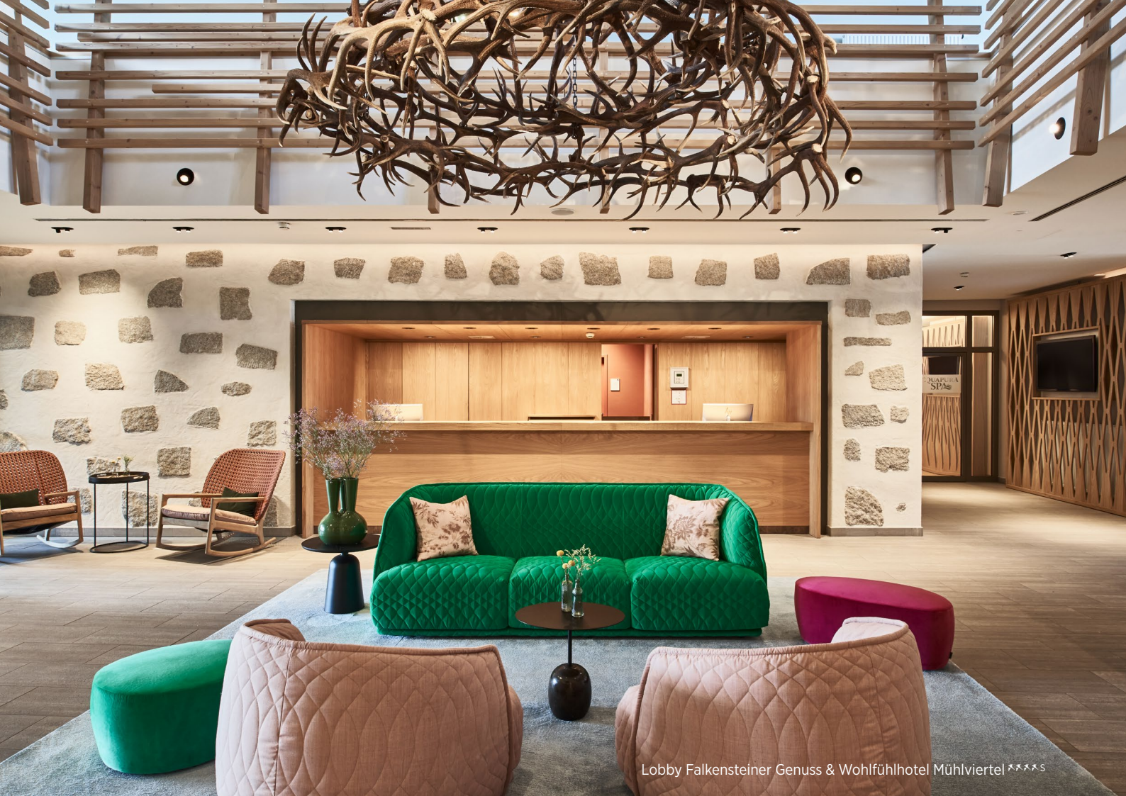
Lobby Falkensteiner Genuss & Wohlfühlhotel Mühlviertel *****