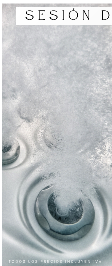
TODOS LOS PRECIOS INCLUYEN IVA