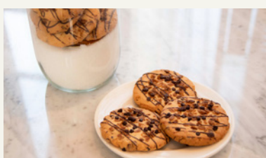
OATMEAL CHOCOCHIP COOKIE