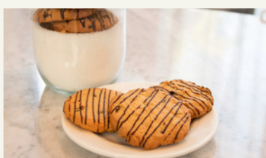
BLACK RAISIN ALMOND COOKIE