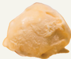
CHANH DÂY PASSION FRUIT