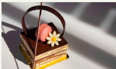
A GENTLE BLEND