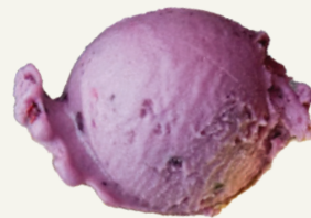
KHOAI MÔN TARO