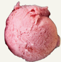
MÂM XÔI RASPBERRY