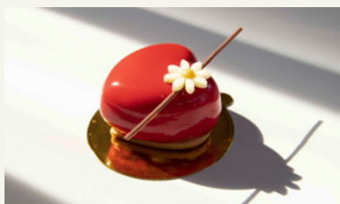
LOVE IS "HURT"