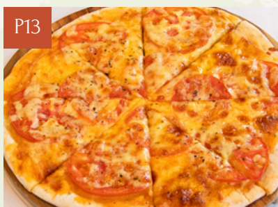
PIZZA CÀ CHUA MARGERITA PIZZA

Giá thông thường Regular Price Giá OHM OHM Price 228,000 207,000