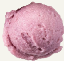
VIỆT QUẤT BLUEBERRY