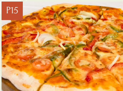
PIZZA RAU CỦ VEGETABLE PIZZA

Giá thông thường Regular Price Giá OHM OHM Price 277,000 252,000