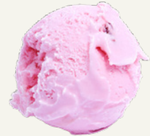
DÂU TÂY STRAWBERRY