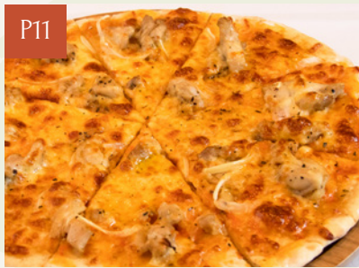
PIZZA GÀ NƯỚNG CHICKEN PIZZA

Giá thông thường Regular Price Giá OHM OHM Price 277,000 252,000