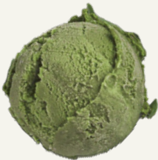
TRÀ XANH MATCHA