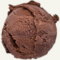
SÔ - CÔ - LA CHOCOLATE