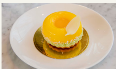
ONE SUNNY DAY