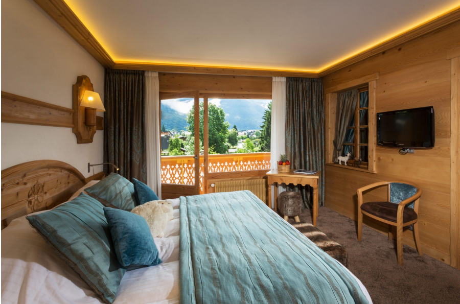
Hôtel Neige et Roc à Samoëns suite luxe