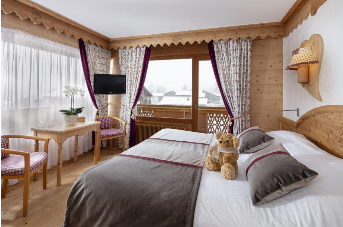
Chambre supérieure d'angle