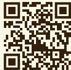
Table reservation recommended

Für den Kickstart am Morgen sorgt das richtige Frühstück bei uns im CHEZ BERNARD. Hier wird aufgetischt, was Herz und Gaumen begehren – von Koffein-Kreationen über Teig-Träume bis hin zu Frühstücks-Fantasien de luxe. Wer seinen Kaffee lieber unterwegs schlürft, holt sich in unserem MOTTO BROT ein schnelles Grab & Go Frühstück.